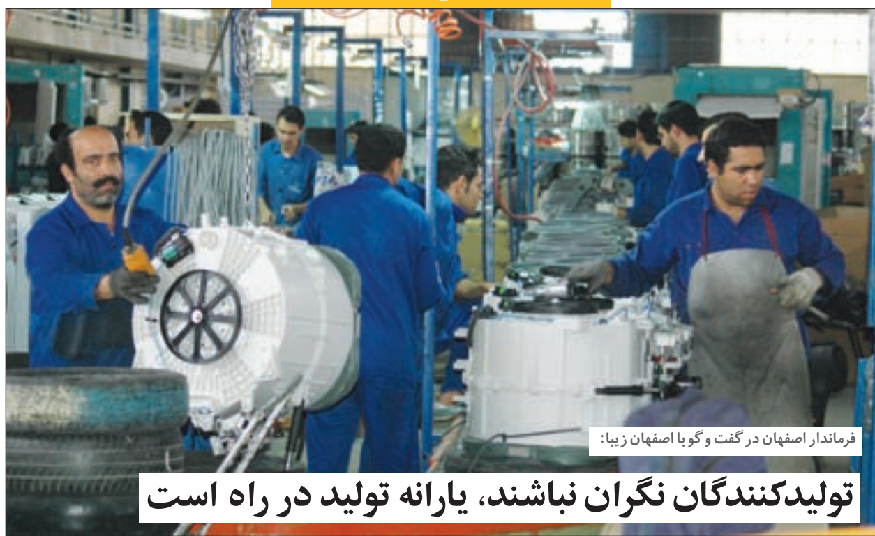
فرماندار اصفهان در گفت‌وگو با اصفهان زیبا:

تولیدکنندگان نگران نباشند، یارانه تولید در راه است