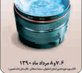
۸ و ۷ مرداد ماه ۱۳۹۰

رجایی پیرامون برنامه سالن شماره دو در این ساعات افزود: در این سالن نیز امروز از ساعت ۱۵ نمایش فیلم‌ها آغاز خواهد شد و فیلم‌های صائبین عباس تحویل‌دار و سرود دشت تیمور محمد گسروهی از فیلم‌های جشنواره به نمایش در می‌آید. این سالن از ساعت ۱۵ امروز نیز میزبان دیگر فیلم‌های جشنواره خواهد بود و نمایش فیلم و گفت‌وگو با فرهاد مهرانفر، جمشید ارجمند، عزیزالله حاجی مشهدی و زاون قوکیاسیان پیرامون فیلمنامه در سینمای مستند راس ساعت ۲۰:۳۰ در این سالن برگزار می‌گردد.