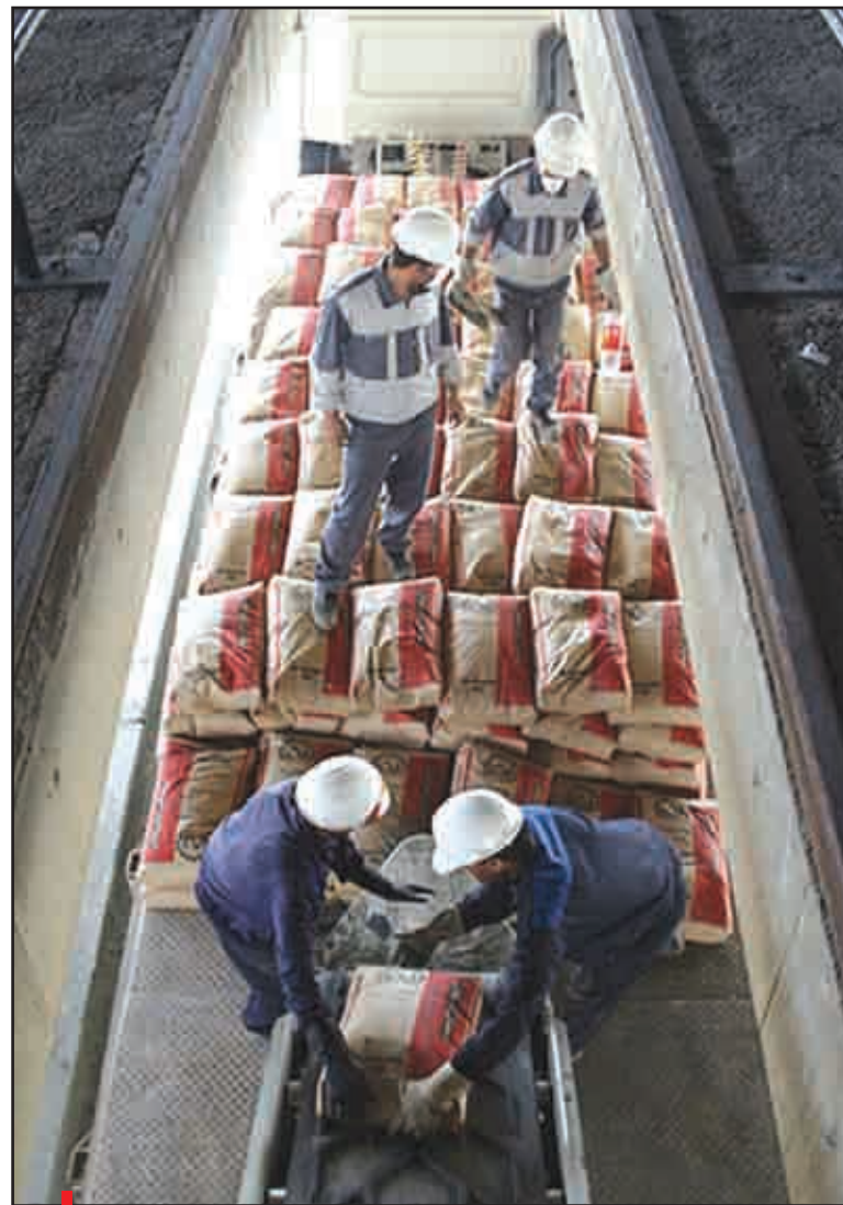
اصفهان زیبا بررسی می‌کند؛