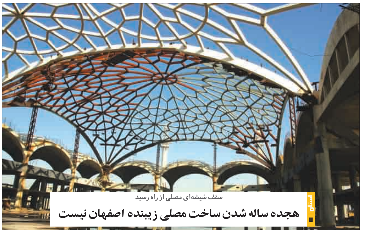
سقف شیشه‌ای مصلی از راه رسید هجده ساله شدن ساخت مصلی زینده اصفهان نیست