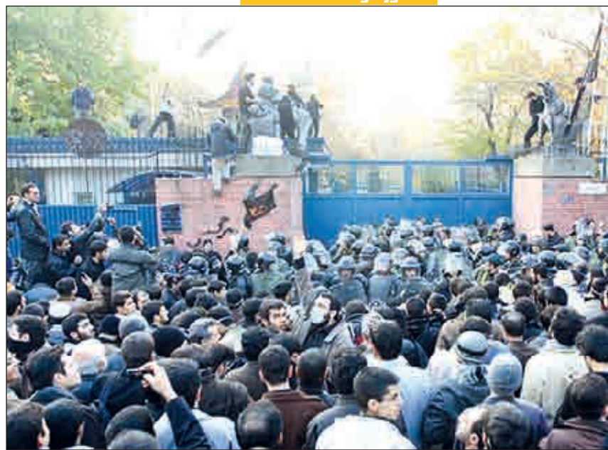
در تجمع اعتراضی دانشجویان مقابل سفارت انگلیس رخ داد: