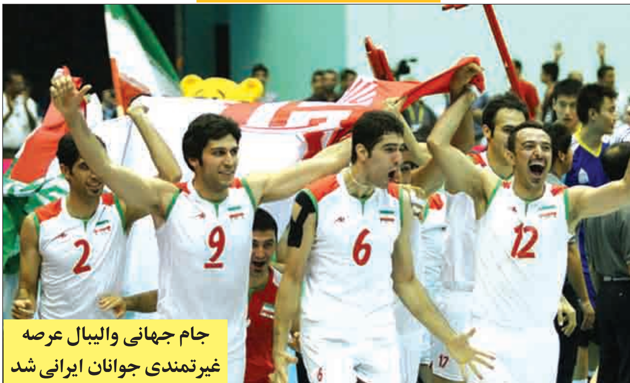
جام جهانی والیبال عرصه غیرتمندی جوانان ایرانی شد