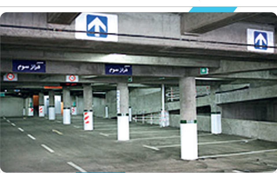
فضای پارکینگ در مرکز شهر اصفهان

محدوده مرکزی شهرها استقرار یابند، تعداد خودروهای شخصی که در معابر محدوده مرکزی شهر تردد می‌کنند را کاهش می‌دهد اما ساخت آن در هسته مرکزی شهر در همسایگی کاربری‌های تجاری، اداری و تفریحی تنها انگیزه شهروندان برای استفاده از خودروهای شخصی برای سفر به مرکز را افزایش می‌دهد و بر حجم ترافیکی این محدوده می‌افزاید. احداث پارکینگ‌های طبقاتی در اطراف هسته مرکزی و فراهم ساختن زمینه‌های دسترسی به حمل و نقل همگانی در کنار این کاربری‌های نقش موثر آنها در کاهش بار ترافیکی و حوادث ترافیکی را پررنگ می‌کند.