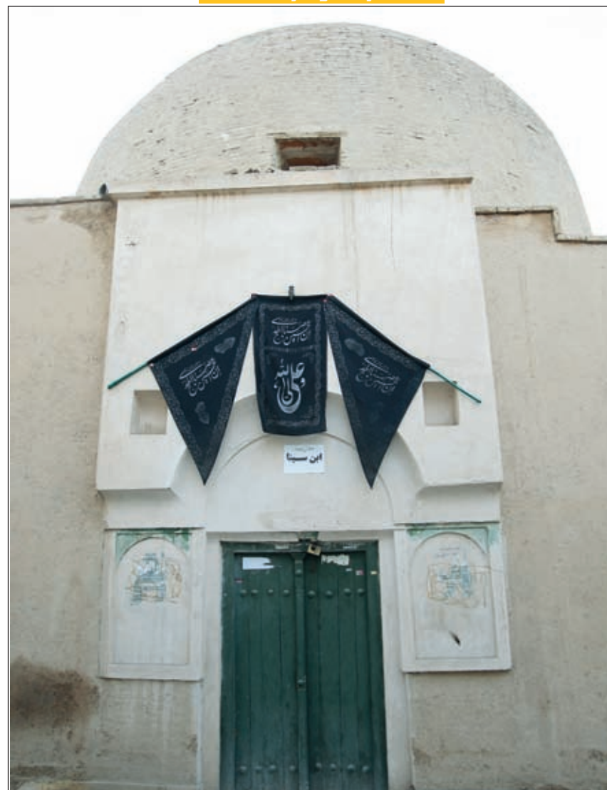
شواهد و منابع تحقیقاتی ثابت می کند که ابوعلی سینا در اصفهان مدفون است