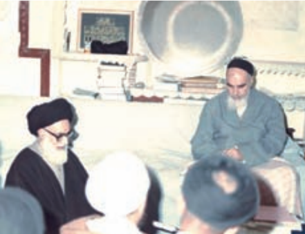
در محضر امام راحل (ره)