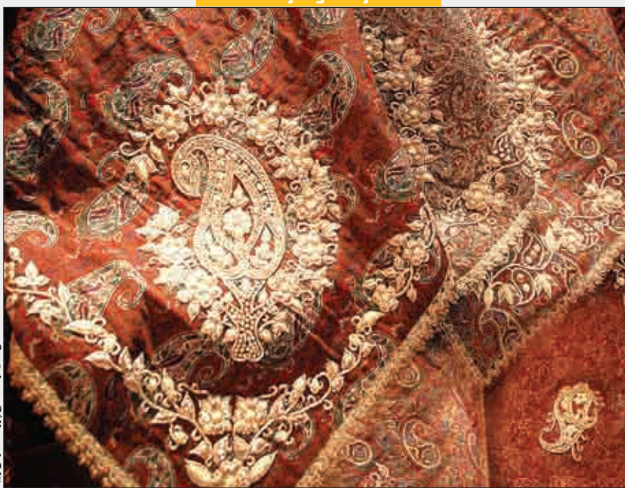
عسکری، استودیو ساخت سجاد بیور / اصفهان زیبا