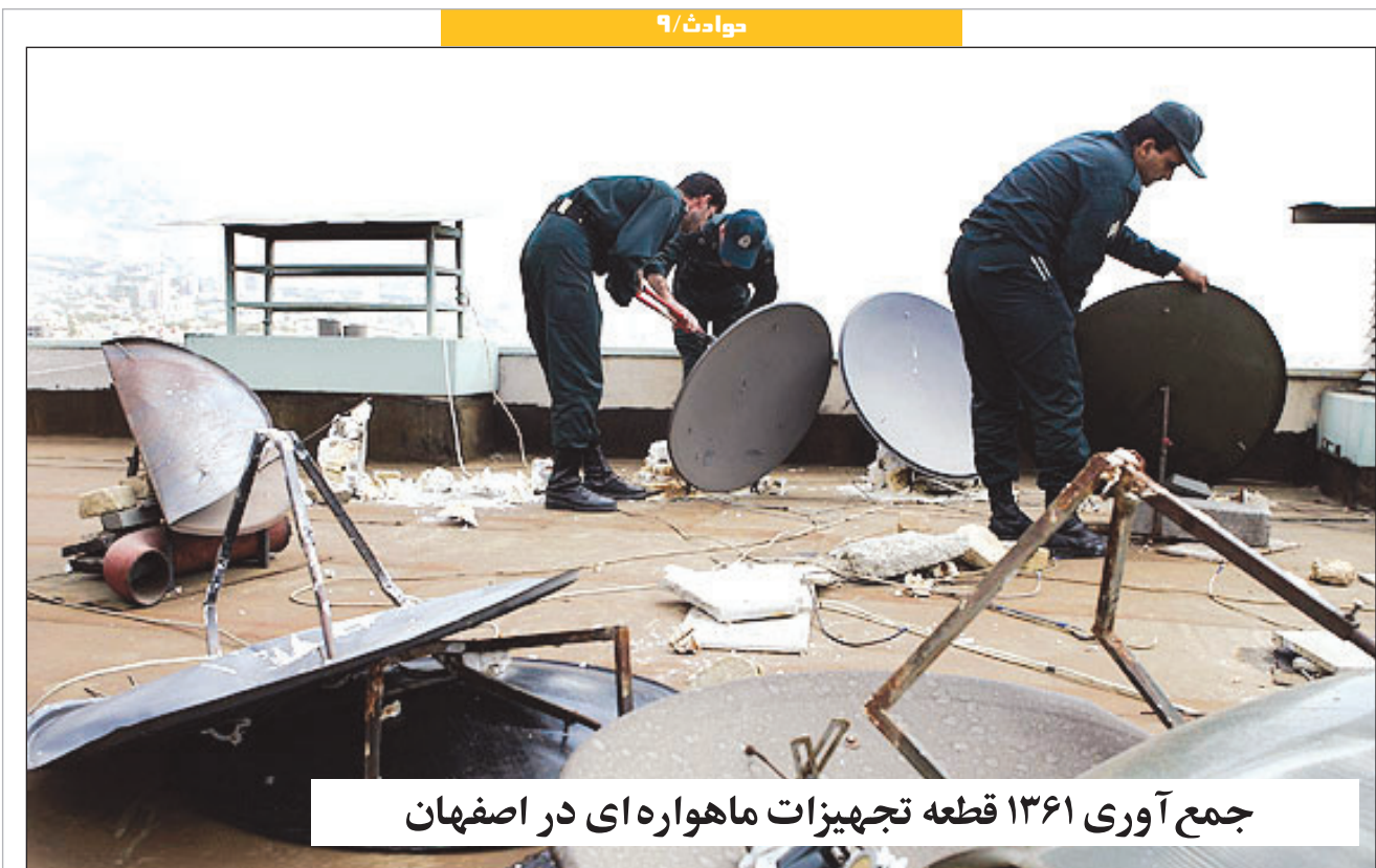
جمع آوری ۱۳۶۱ قطعه تجهیزات ماهواره ای در اصفهان