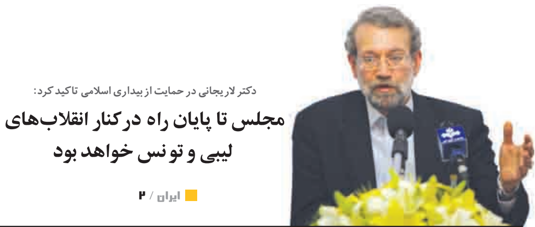
دکتر لاریجانی در حمایت از بیداری اسلامی تاکید کرد: مجلس تا پایان راه در کنار انقلاب های لیبی و تونس خواهد بود