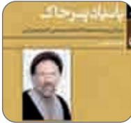
مبارک پسر خاک