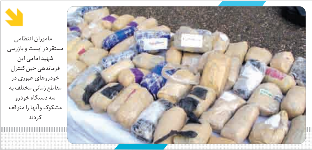
خبر گروه حوادث

ماموران فرماندهی انتظامی شهرستان های شهرضا ، سمیرم و یگان تکاوری استان اصفهان در جریان پنج عملیات و در بازرسی پنج دستگاه خودروی سبک و سنگین نزدیک به ۳۵۰کیلو گرم انواع مواد مخدر را کشف و ضبط کردند .