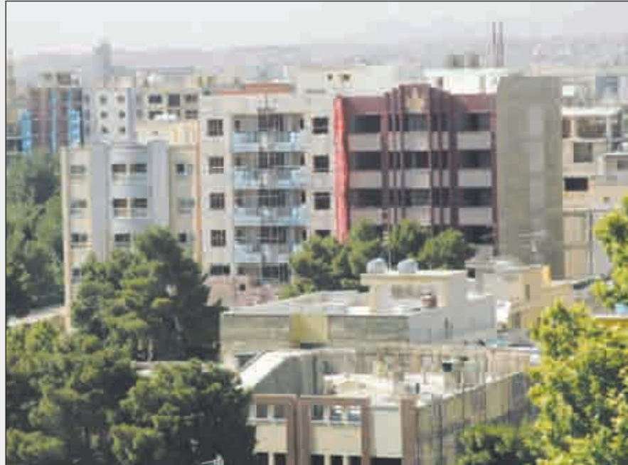
اعضای شورای اسلامی شهر اصفهان خواستار شدند:

نمای ساختمان‌ها مطابق با معماری ایرانی - اسلامی ساخته شود