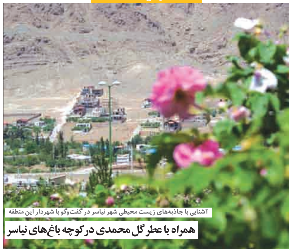
آشنایی با جاذبه‌های زیست محیطی شهر نیاسر در گفت‌وگو با شهردار این منطقه