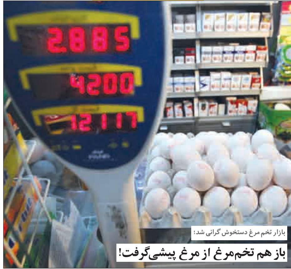
بازار تخم مرغ دستخوش گرانی شد!