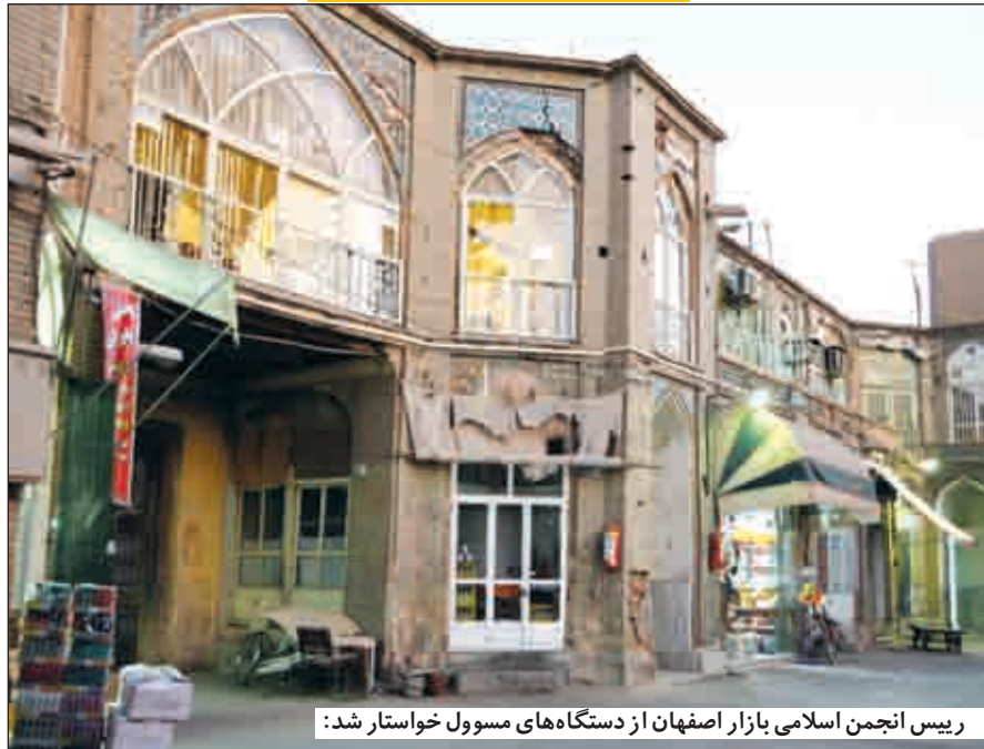
رییس انجمن اسلامی بازار اصفهان از دستگاه‌های مسوول خواستار شد: