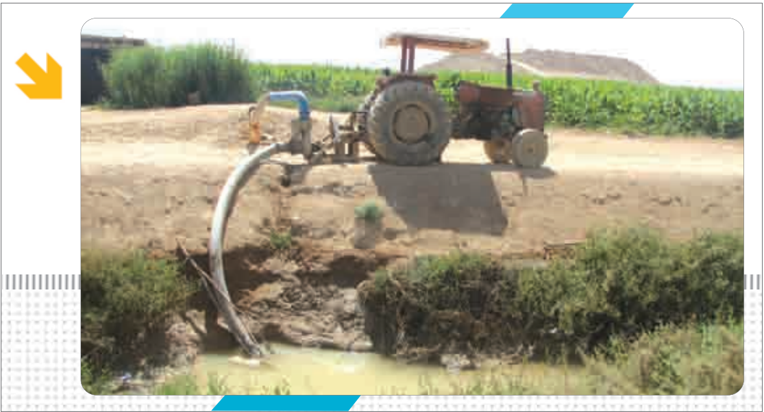
در همین زمینه

فاضلاب‌های شهری دارای انواع آلاینده‌های شیمیایی نظیر موادسمی و فلزات سنگین و موادآلی مثل: «هیدروکربنها، دترجنت‌ها، چربی‌ها و روغن‌ها) و میکرو ارگانیزم‌های زنده‌ای از قبیل: ویروس‌ها، باکتری‌ها و کلیفرم‌های مدفوعی، پروتوزوئرها و کرم‌ها می‌باشند که با ورود این فاضلاب‌های تصفیه نشده به محیط زیست و تماس با منابع آب‌های سطحی و زیرزمینی و خاک‌ها باعث آلودگی این منابع با ارزش می‌گردند و در صورت استفاده انسان از این منابع خطر گسترش بیماری‌های مختلفی بین مردم به وجود می‌آید که حداقل ۲۱ مورد شیوع بیماری به وسیله سبزی‌های آلوده به مدفوع یا فاضلاب خام گزارش شده است.