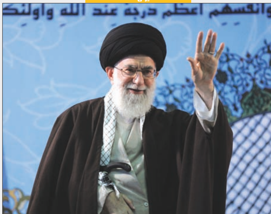
فرمانده معظم کل قوا در اجتماع پرشور بسیجیان کرمانشاه تاکید کردند:

لازمه دیپلماسی هوشمند و با ابتکار عمل، روحیه بسیجی است