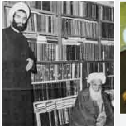
دیدار آیت‌الله با امام خمینی