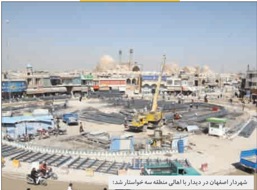
شهردار اصفهان در دیدار با اهالی منطقه سه خواستار شد؛