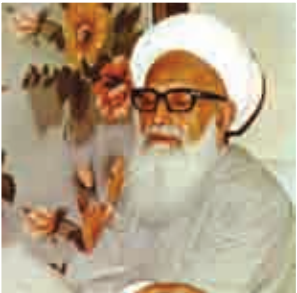
آخرین عکس آیت‌الله قبل از حضور ایشان در نماز جمعه و شهادت وی