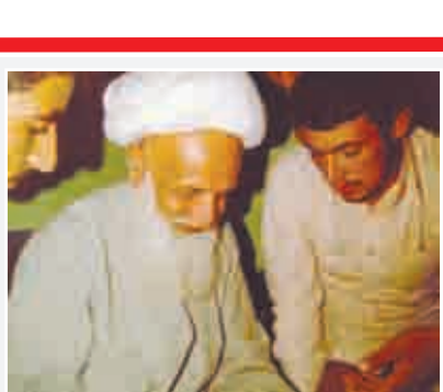
آیت الله در حال پاسخگویی به یکی از سوالات جوانان