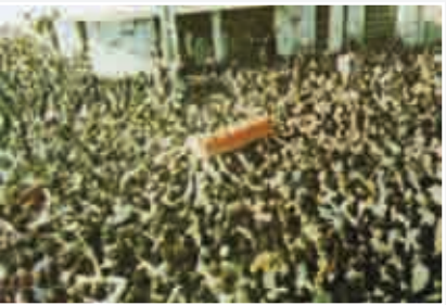
مراسم تشییع پیکر آیت‌الله در کرمانشاه