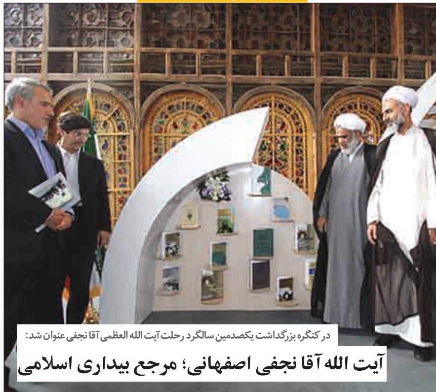
در کنگره بزرگداشت یکصدمین سالگرد رحلت آیت الله العظمی آقا نجفی عنوان شد: آیت الله آقا نجفی اصفهانی؛ مرجع بیداری اسلامی