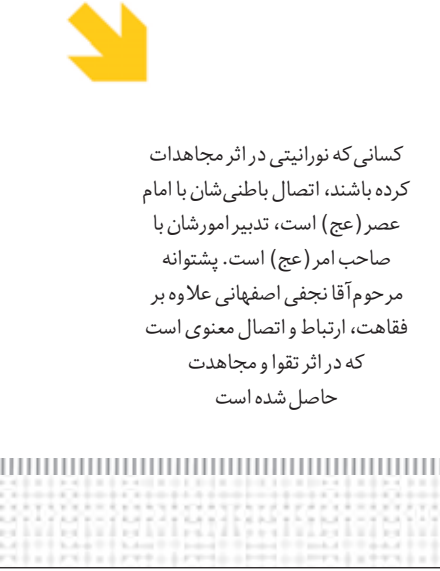
کسانی که نورانیتی در اثر مجاهدات کرده باشند، اتصال باطنی‌شان با امام عصر(عج) است، تدبیر امورشان با صاحب امر(عج) است. پشتوانه مرحوم آقا نجفی اصفهانی علاوه بر فقاقت، ارتباط و اتصال معنوی است که در اثر تقوا و مجاهدت حاصل شده است

آیت‌الله مظاهری با بیان این‌که پیغمبر(ص) می‌فرمودند مناظ ولایت دو چیز است؛ یکی علم، یکی تقوا؛ افزودند: حکومت ولایت باید از طرف خدا باشد. سقیفه‌ی بنی ساعده یک چیز مشهور را که همه می‌دانستند به هم زد، گفت: حکومت منهای ولایت، منهای علم، منهای عصمت. به عبارت امروزی‌ها دین منهای سیاست، سیاست منهای دین. حکومت مال یکی اما تبیین قرآن و تبیین اسلام مال دیگری و این زحمات پیغمبر اکرم(ص) را به هدر داد.