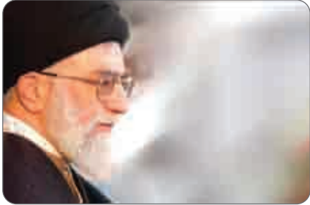
به هر حال کار بسیار خوبی است این بزرگداشت صد سالگی رحلت ایشان. و ان‌شاءالله که بتوانید از آن استفاده کنید در همین جهاتی که ذکر کردید؛ حرف‌های شما کامل و خیلی خوب بود. ان‌شاءالله موفق باشید.