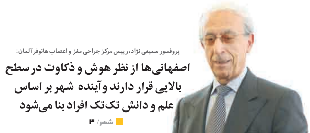
پروفسور سمیعی نژاد، رئیس مرکز جراحی مغز و اعصاب هانوفر آلمان: اصفهرانی‌ها از نظر هوش و ذکاوت در سطح بالایی قرار دارند و آینده شهر بر اساس علم و دانش تک تک افراد بنا می‌شود