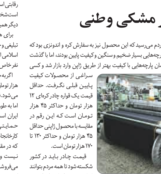
مردم می‌رسید که این محصول نیز به سفارش کره و اندونزی بود که پارچه‌هایی بسیار ضخیم و سنگین و کیفیت پایین بودند، اما با گذشت زمان پارچه‌هایی با کیفیت بهتر از طریق ژاپن وارد بازار شد و کسی سراغی از محصولات کیفیت پایین قبلی نگرفت. حداقل قیمت یک قواره چادر گرمای ۱۲ هزار تومان و حداکثر ۴۵ هزار تومان است که این رقم در مقایسه با محصول ژاپنی حداقل ۴۵ هزار تومان و حداکثر ۱۳۰ هزار تومان است.

برای هر چیزی در تولیدیون تبلیغ وجود دارد، اما برای چادر هیچ تبلیغی وجود ندارد؛ در حالی‌که چادر سنت رایج کشور ما و هویت ایرانی اسلامی است. سفارش چادر در ژاپن و واردات آن به کشور در دست چند نفر خاص است که شاید به تعداد انگشت‌های دودست نرسد. اگر به طور متوسط قیمت تمام‌شده این محصول برای تاجران یکصد هزار تومان باشد سودی نجومی از این محصول عاید تاجار چادر مشکی می‌شود. قبلا به صورت مقطعی گفته شد که چادر ایرانی تولید می‌شود، اما به طور نمونه نیز یک سری تولید نشد که بگویند این چادر محصول ایران است. چادر تنها کالای مصرفی و منظوم کشور است که هیچ حمایتی از تولید آن نمی‌شود. تاجران عربی با دادن سفارش به کارخانجات تولید این محصول سفارش کیفیت پایینی از چادر ارامی دهند که در مقایسه با نوع وارداتی آن به کشور از کیفیت مطلوبی برخوردار نیست و از سوی دیگر در فروش آن به زایران با مقیاس «بارد» می‌فروشند که خریدار بعد از ورود به کشور و ارزیابی بازار متوجه نقص کیفیت و یکامبود متراز چادر می‌شود. وارد کردن پارچه در دسر ندارد نوع نگرش ساده کارخانجات تولید پارچه‌های مجلسی به دسترس‌ی آسان خریداران و تاجران به این محصولات خودشان و آشنایی با بازار ایران و بندها و نصره‌های خوبی که برای ورود کالای خارجی به ایران وجود دارد راه ورود این محصول و خریداری آن را به کشور ساده کرده است.