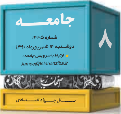
شماره ۱۳۴۵ دوشنبه ۱۴ شهریورماه ۱۳۹۰ارتباط با سرویس جامعه: Jamee@lsfahanziba.ir