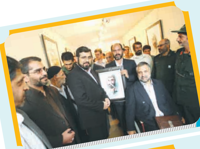
تقدیر از پدران شهیدا به مناسبت هفته دفاع مقدس