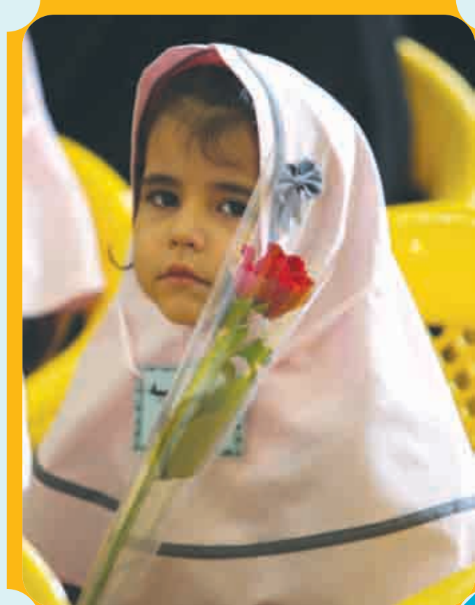
باز آمد بوی ماه مدرسه بوی بازی های راه مدرسه ...