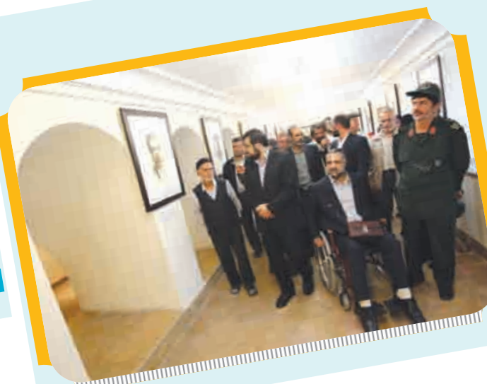
بازدید مسوولین شهری از نمایشگاه تصاویر شهیدا