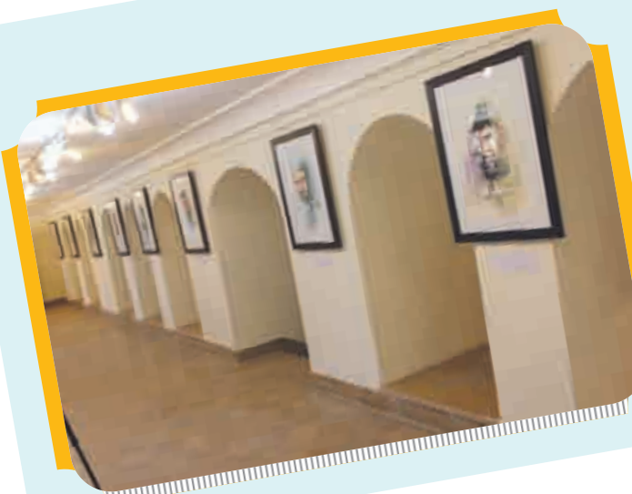
نمایشگاه آثار استاد شعر یاف از چهره های شهیدا