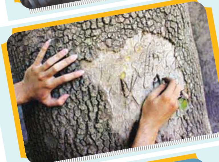
جایی مناسب تر برای ثبت خاطرات نیست؟!