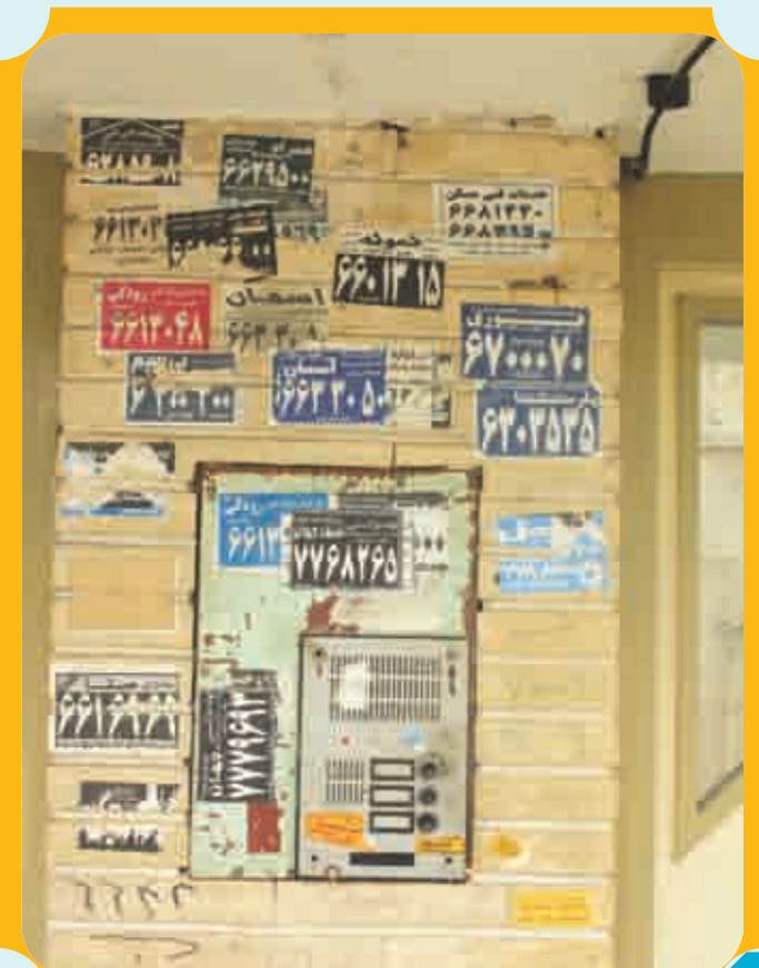
تبلیغات موثر و سازگار با ساختار شهری! ...