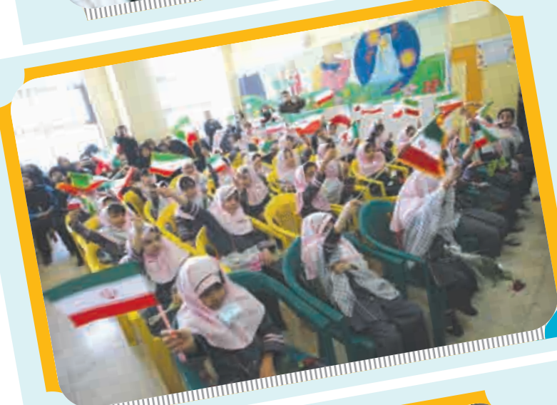
جشن شکوفه ها