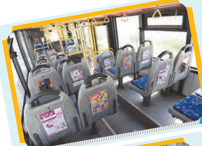
چند دقیقه مطالعه در اتوبوس های شهر