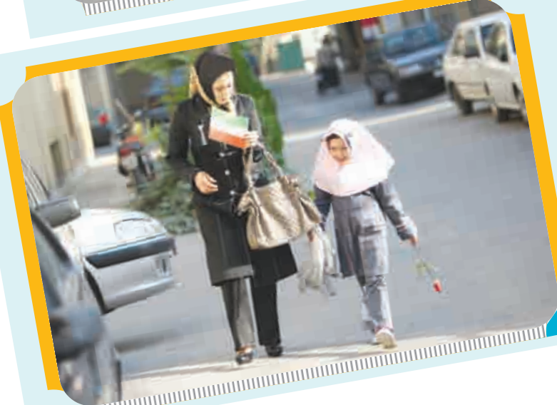
کلاس اولی ها راهی مدرسه شدند