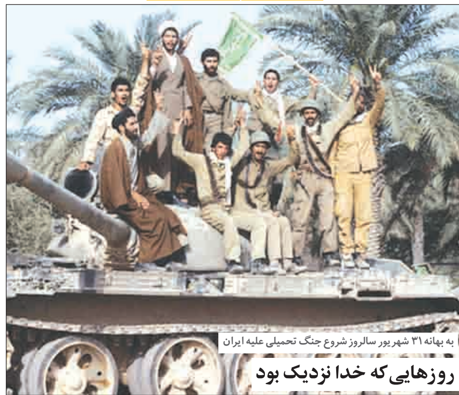
به بهانه ۳۱ شهریور سالروز شروع جنگ تحمیلی علیه ایران روزهایی که خدا نزدیک بود