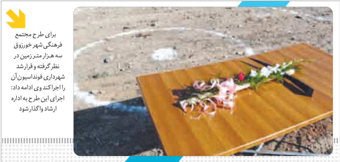
بر خوار گروه شهروستان

در روزهای اخیر شهردستان بر خوار میزان حضور وزیر ارشاد، برای بازدید از طرح های فرهنگی این شهرستان، از جمله دانشکده علوم قرآنی شهرستان بر خوار ونیز آغاز ساخت چند طرح فرهنگی دیگر بود.اما مهیا نبودن زمین بعضی از این طرح ها، ایهاماتی در ذهن به وجود می آورد که این طرح ها آیا به سرانجامی می رسند یا همانند بهره برخی از مصوبات سفر ریاست جمهوری در این شهرستان ، به دلیل آماده نبودن زیر ساخت ها، هنوز انتظار بهره برداری را می کشند .