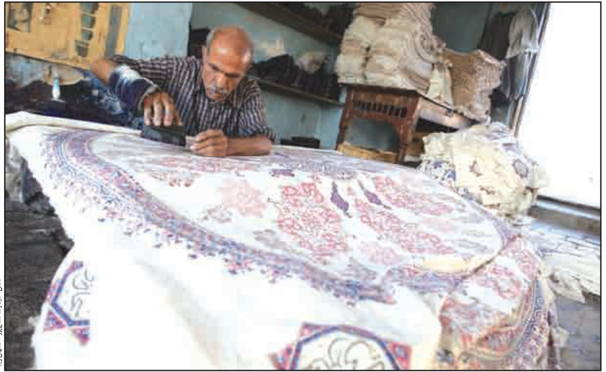
چرخه معیوب صنایع دستی، استادکاران را یکی پس از دیگری بیکار می‌کند: