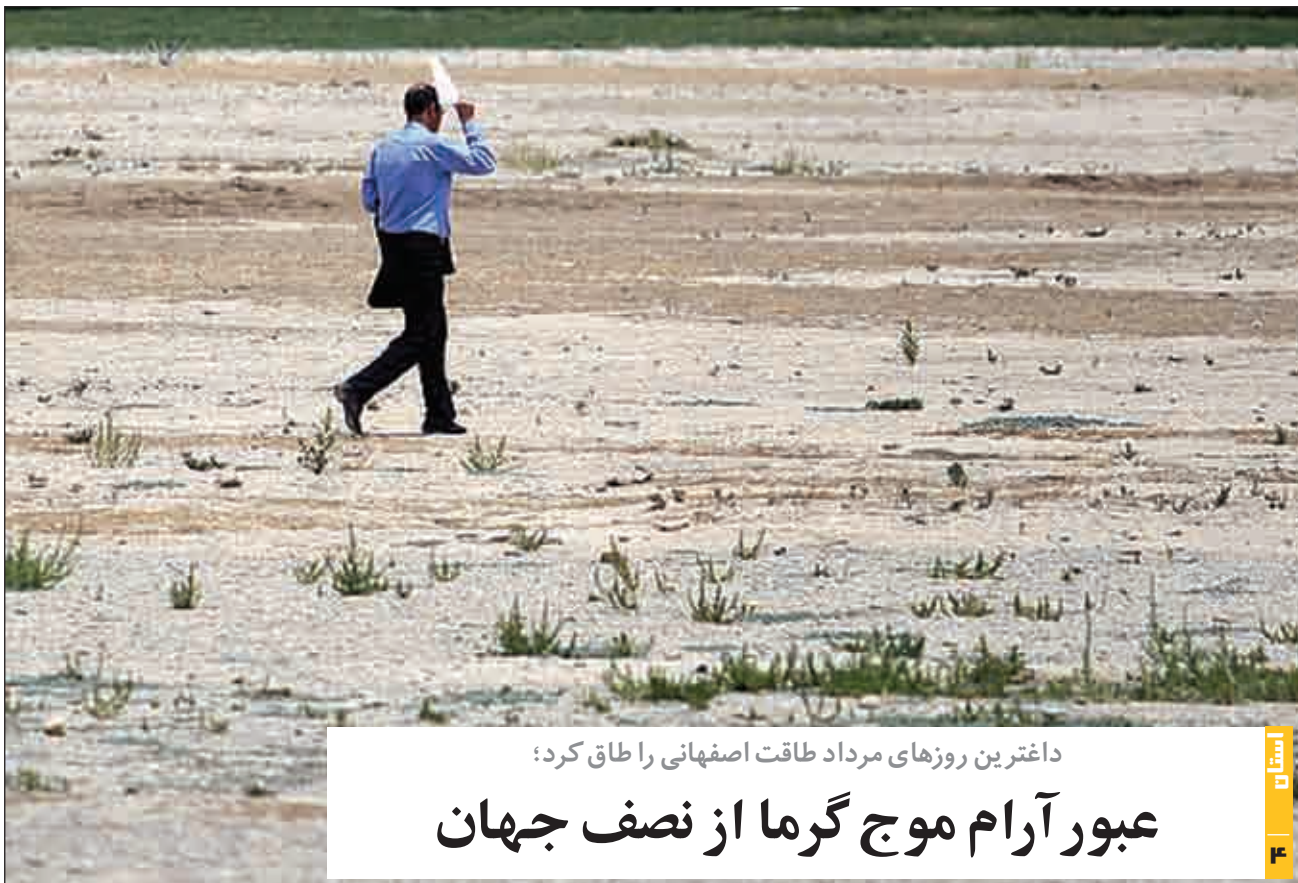
داغترین روزهای مرداد طاق اصفهانی را طاق کرد؛