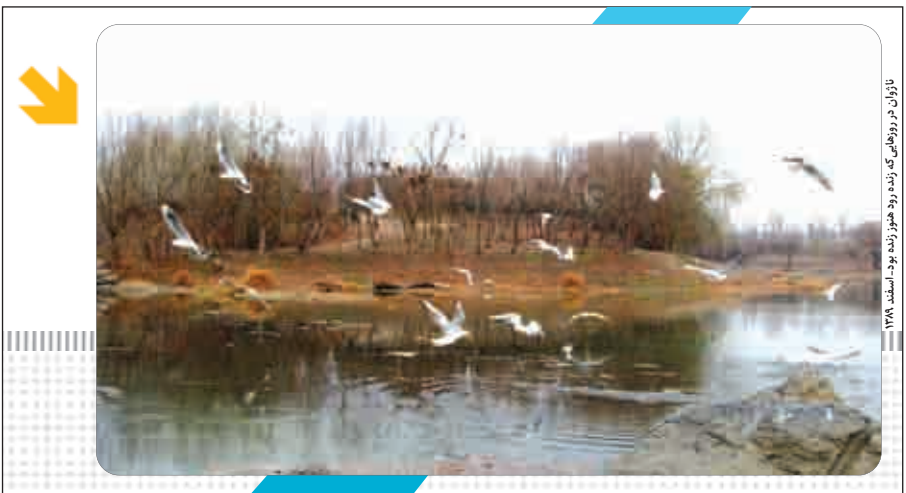
ناژوان در روزهایی که زرد زهر زنده بود.سند ۱۳۸۸