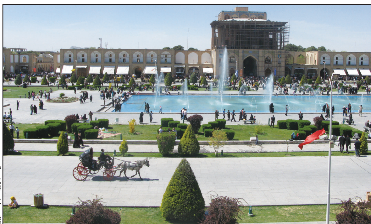
مدیرکل امور اجتماعی استانداری اصفهان: