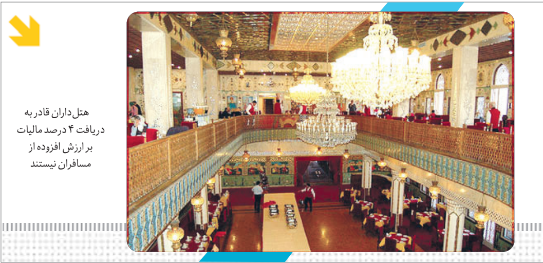
هتل داران قادر به دریافت ۴ درصد مالیات بر ارزش افزوده از مسافران نیستند