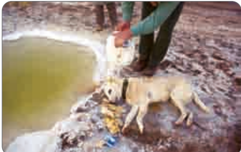
نجات سگ به دست محیط‌بان اردستان