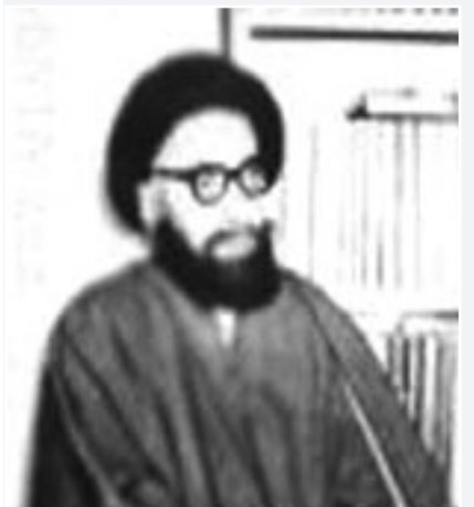
مرحوم آیت الله حاج آقا حسین خادمی