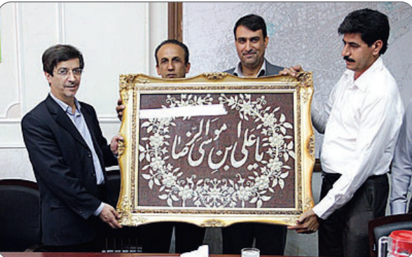
اهالی منطقه یازده با اعضای لوح یادبود به شهردار اصفهان از تلاش های صورت گرفتهدر این منطقه قدردانی کردند

دکتر سید مرتضی سقائیان نژاد در دیدار با تعدادی از شهروندان منطقه ۱۱ که برای تقدیر و تشکر از اقدامات انجام شده در این منطقه در این ملاقات حضور یافته بودند گفت: هیچ ارزشی بالاتر از کسب رضایت مردم نیست. اگر شهرداری حمایت های مردم را نداشت هیچ یک از پروژه