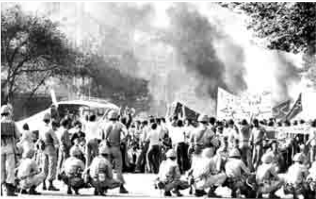
ساواک گزارش می دهد: خیلی محرمانه