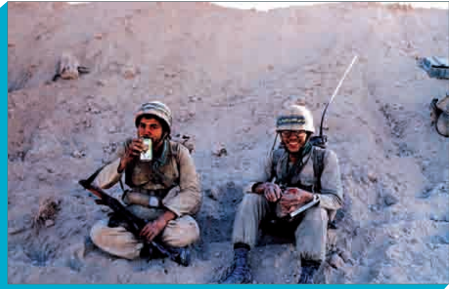
دو سرباز ایرانی