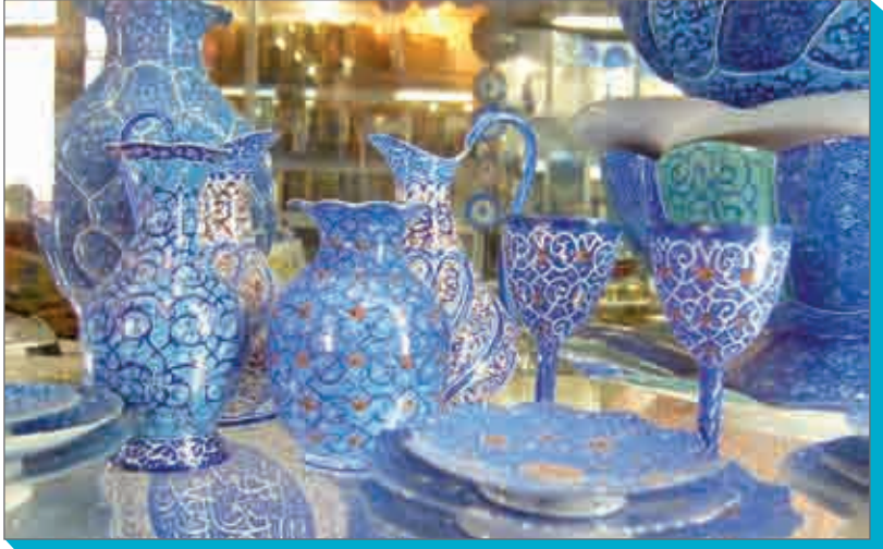
صنایع دستی در بازار تهران