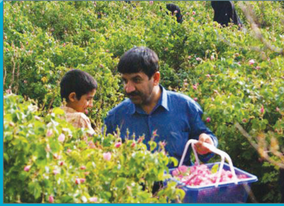
محیط زیست در هفته‌ای که گذشت