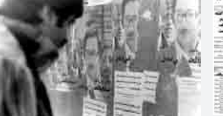
... و بنی صدر از فرماندهی کل قوا عزل شد