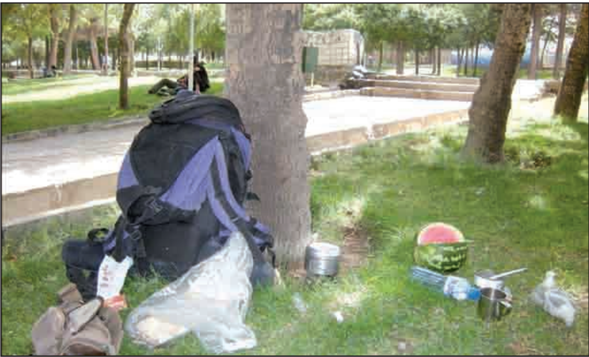
پیش‌بینی‌ها از کاهش مسافر و گردشگر می‌گویند