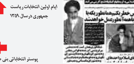
امام امت هشتاد می‌دهد...