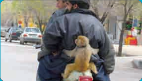
می‌شود به ما کمک کنید، ما در بدریم