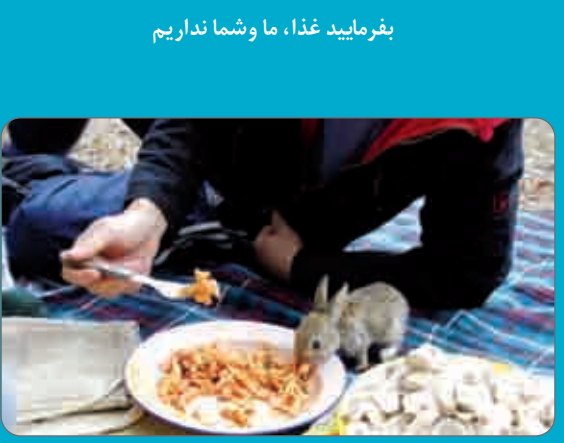
بفرمایید غذا، ما وشما نداریم

به همین دلیل در سال‌های اخیر سلامت جسمی و