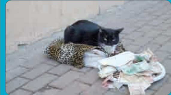
می‌شود به ما کمک کنید، ما در بدریم