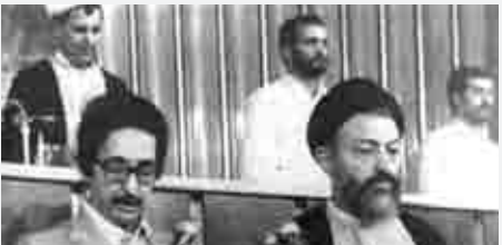
... قسم می‌خورم به اسلام و قانون اساسی وفادار بمانم... مراسم تحلیف در مجلس شورای اسلامی در کتک شهید مظلوم آیت اله دکتربهشتی