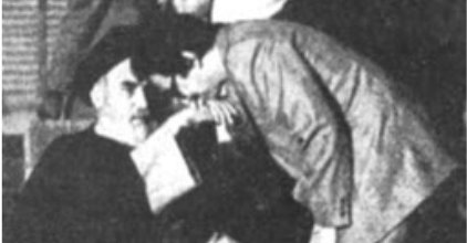
مراسم تحفیذ ریاست جمهوری در محضر امام خمینی (ره)