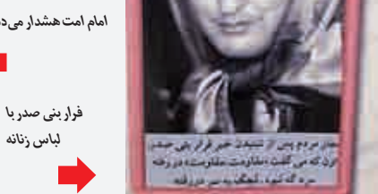
در همین زمینه

خاطره آیت‌الله مهدوی کنی از میهمانی منزل بنی صدر