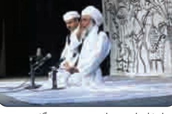
فراموشی هستند و هدف اصلی ما از این کار توجه و عنایت به حفظ اشاعه فرهنگ بومی ملی خودمان است با این امید که این فرهنگ دستمایه خلق آثار جدیدتر قرار گیرد. وی همچنین گفت: در جستجو میان شهرها و روستاهای مختلف هنرمندان سحری خوانی را شناختیم که بسیار متبحر بود به طوری که تمامی ردیفها و گوشه های

توسط حوزه هنری اصفهان برای اولین بار در اصفهان انتشار می یابد آلبوم آوای مذهبی از دل با او اردیبهشت ماه شروع شده و قرار است آلبوم مرداد ماه آماده شده و عرضه عمومی شود. وی در خصوص نکات مهم در انتخاب آوازه ها توضیح داد: کیفیت و ارزش موسیقی، کیفیت و ارزش ادبی، معنوی بودن کار در انتخاب اهمیت دارد. رهبری در مورد هدف از جمع آوری و آرایه این اثر معنوی سطح استان انجام می شود خاطر نشان کرد: این کار از