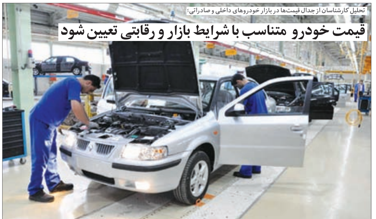
تحلیل کارشناسان از جدال قیمت‌ها در بازار خودروهای داخلی و صادراتی؛