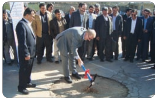
رئیس خانه صنعت و معدن اصفهان: