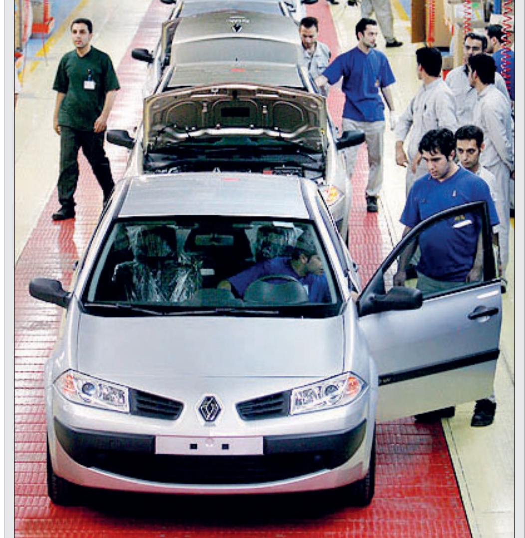
جزئیات مصوبه جدید کمیته خودرو؛