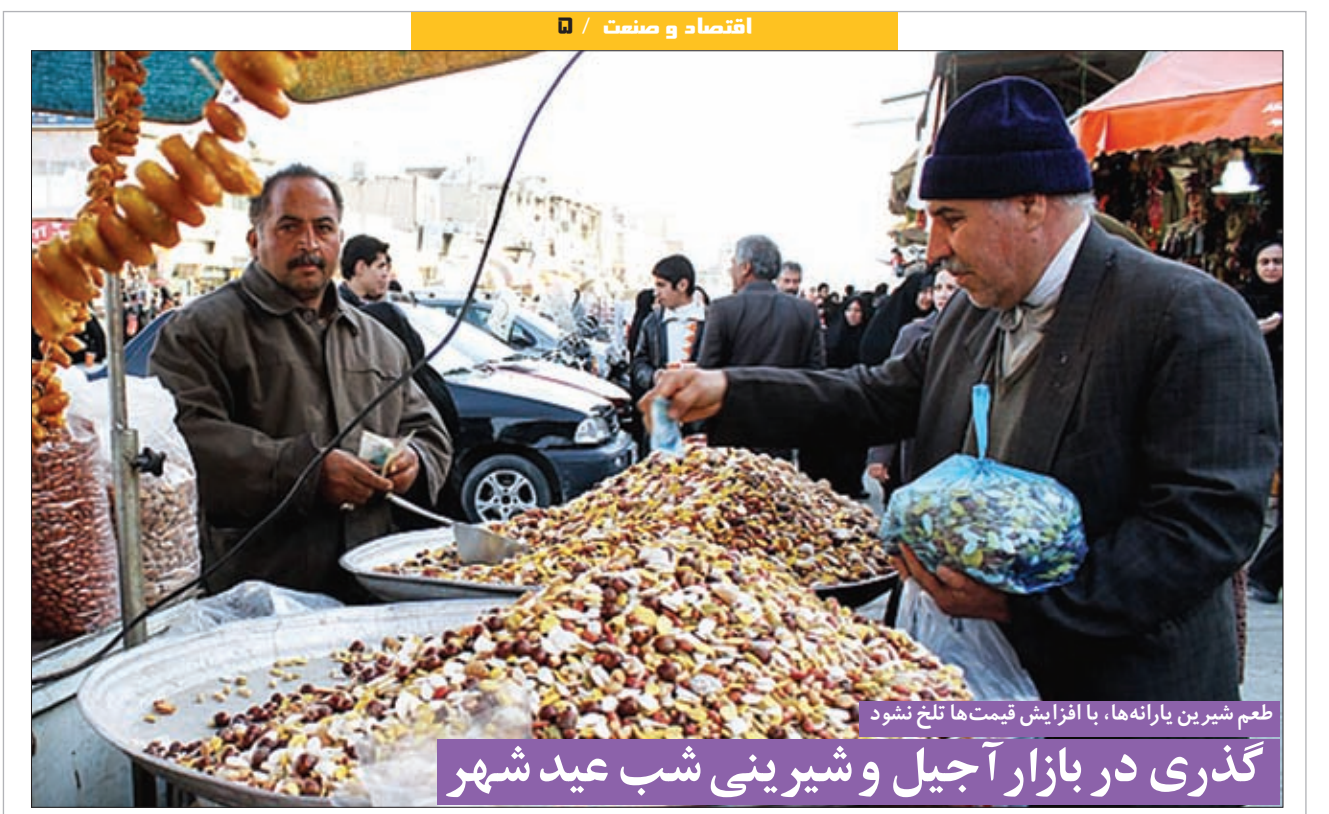
گذری در بازار آجیل و شیرینی شب عید شهر طعم شیرین بارانها، با افزایش قیمت ها تلخ نشود

سرانه درمان، همان بودجه ای است که دولت متعهد به پرداخت آن می شود به ازای هر نفر بیمه شده، تا واریز صندوق های بیمه شود و مردم همه هزینه درمان را نپردازند. این سرانه همه ساله به صورت مبلغی تعیین و در بودجه کشور قید می شود. به طور طبیعی این هزینه باید مطابق مبالغ واقعی تورم و درمان محاسبه شود ولی هر ساله دولت برای تعیین سرانه درمان به جیب خودش نگاه می کند و توجهی به تورم ندارد. بیمه ها نیز به علت ماهیت دولتی به صندوق هایی تبدیل شده اند که اعتبار می گیرند و هر چند که افزایش سرانه به نفع آنهاست ولی نمایندگان بیمه به عنوان عضو شورای عالی بیمه و شورای سلامت با افزایش سرانه درمان مخالفت می کنند؛ چرا که در نهایت این صندوق ها هستند که باید تعرفه سلامت را پوشش دهند و به طور حتم