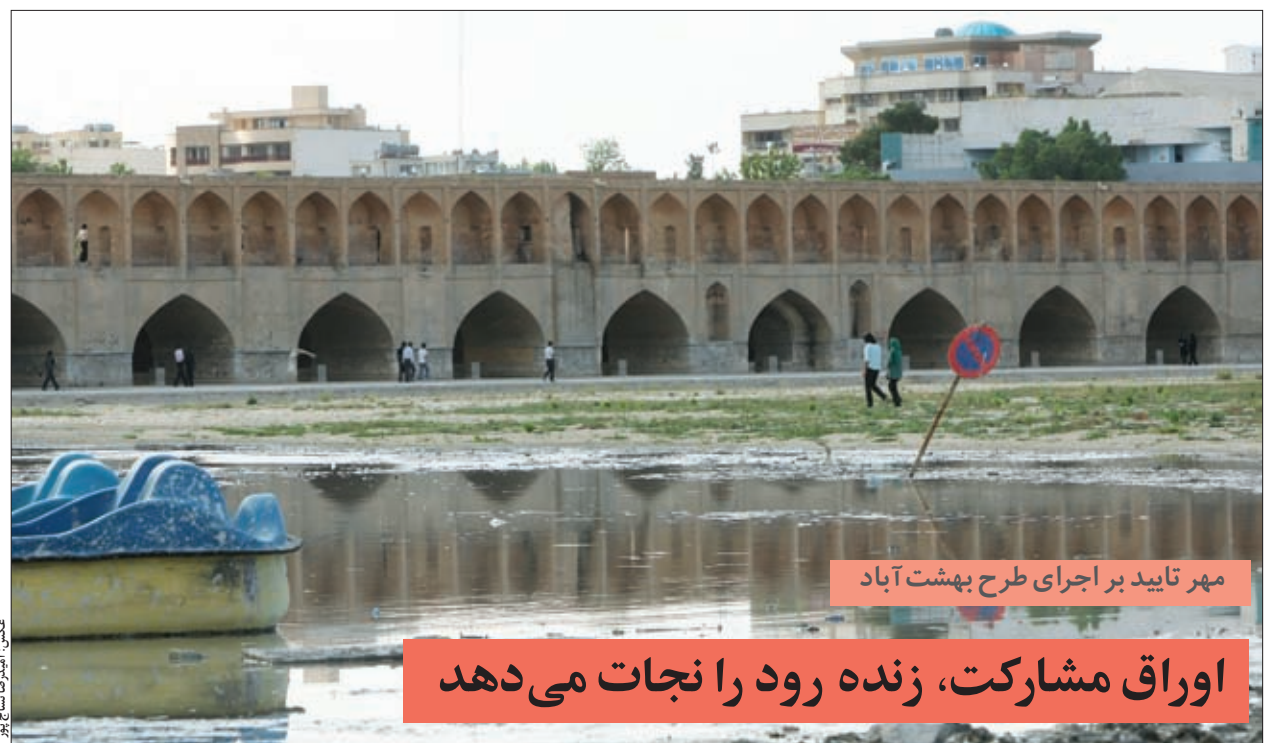
مهر تایید بر اجرای طرح بهشت آباد