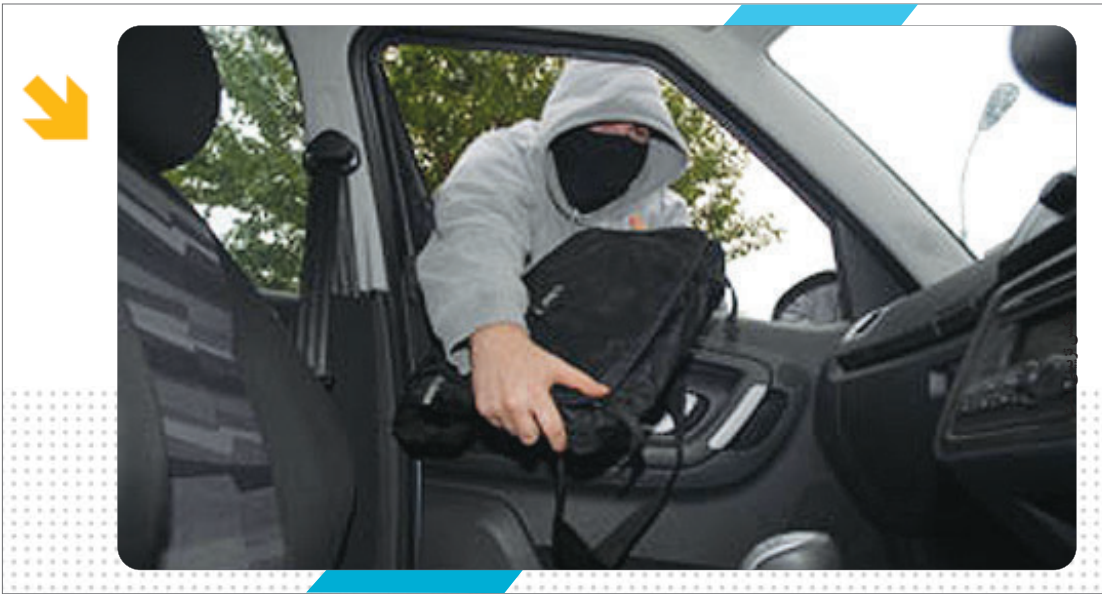
خبر گروه حوادث

مرکز اطلاع رسانی پلیس اصفهان : با تلاش و همکاری یکی از نگهبانان محله شهر اصفهان با پلیس ۱۱۰ یک سارق حرفه‌ای که برای گمراه کردن ماموران در یکی از مجتمع‌های مسکونی ساکن شده بود شناسایی و دستگیر شد. سرهنگ «هوشنگ انصاری» رییس پلیس پیشگیری فرماندهی انتظامی استان اصفهان صبح دیروز در گفت‌وگو با این پایگاه گفت: با تلاش و همکاری نگهبان محله یکی از شرکت‌های زیر نظر اداره انتظامی پلیس پیشگیری استان با پلیس ۱۱۰ یک سارق داخل خودروی حرفه‌ای دستگیر و تعدادی اموال مسروقه نیز از وی کشف و ضبط شد.