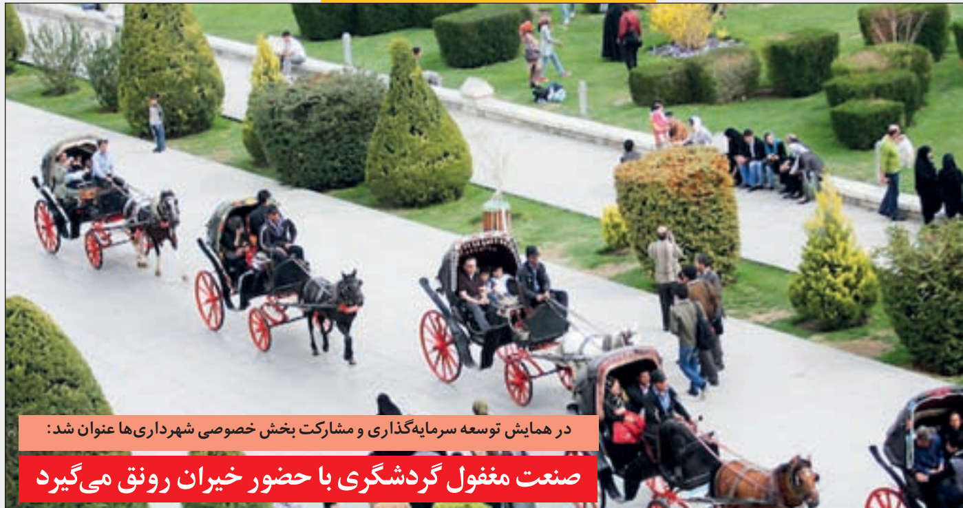
در همایش توسعه سرمایه گذاری و مشارکت بخش خصوصی شهرداری ها عنوان شد:

صنعت مغفول گردشگری با حضور خیران رونق می گیرد