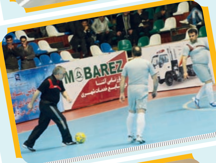
فوتسال استاندارد و جمعی از مسوولین شهری