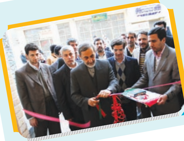
افتتاح خانه انقلاب اسلامی و ولایت توسط مشاور مقام معظم رهبری