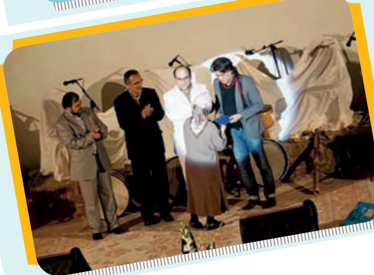
مراسم اختتامیه سومین جشنواره فیلم فجر در استان اصفهان