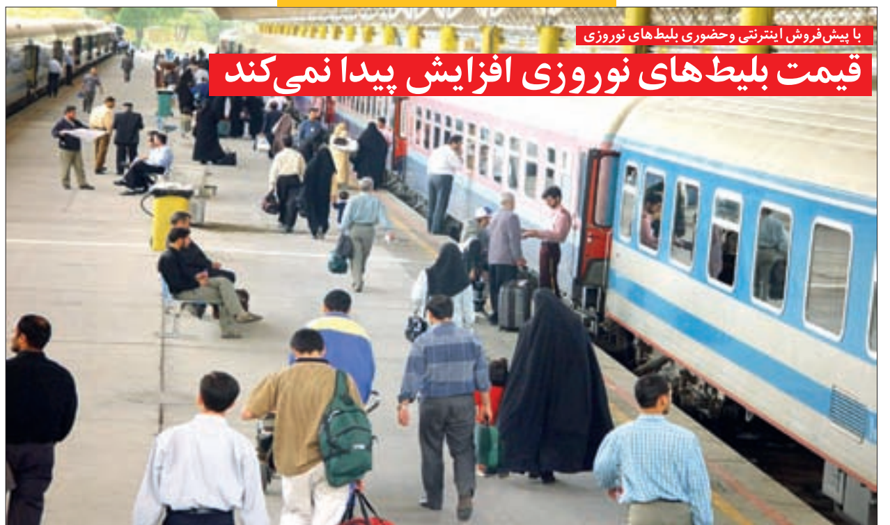
با پیش فروش اینترنتی و حضوری بلیط های نوروزی قیمت بلیط های نوروزی افزایش پیدا نمی کند