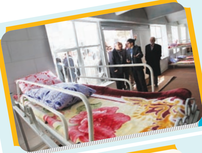
افتتاح مرکز درمانی معتادین در اصفهان