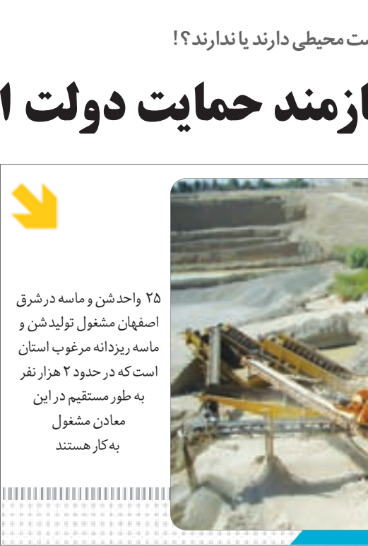
نمای هوایی از معدن معادن مشغول در شرق اصفهان

۲۵ واحد شن و ماسه در شرق اصفهان مشغول تولید شن و ماسه ریزدانه مرغوب استان است که در حدود ۲ هزار نفر به طور مستقیم در این معادن مشغول به‌کار هستند