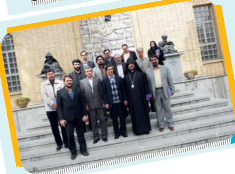
عکس یادگاری شهردار و جمعی از مسوولین شهری با اسقف آرامنه