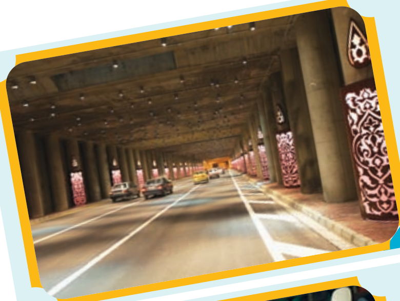
نورپردازی زیرگذر خیابان امام سجاده (ع)