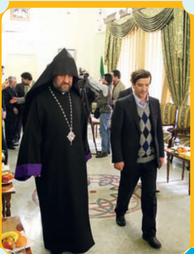
دیدار شهردار با اسقف آرامنه اصفهان