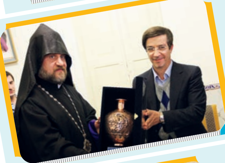
تبریک سال جدید میلادی به آرامنه اصفهان توسط شهردار