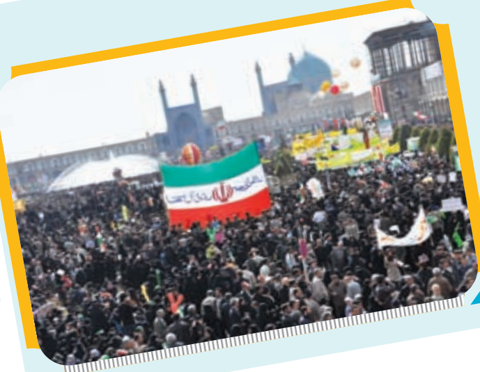
حضور پرشکوه مردم در راهپیمایی ۲۲ بهمن