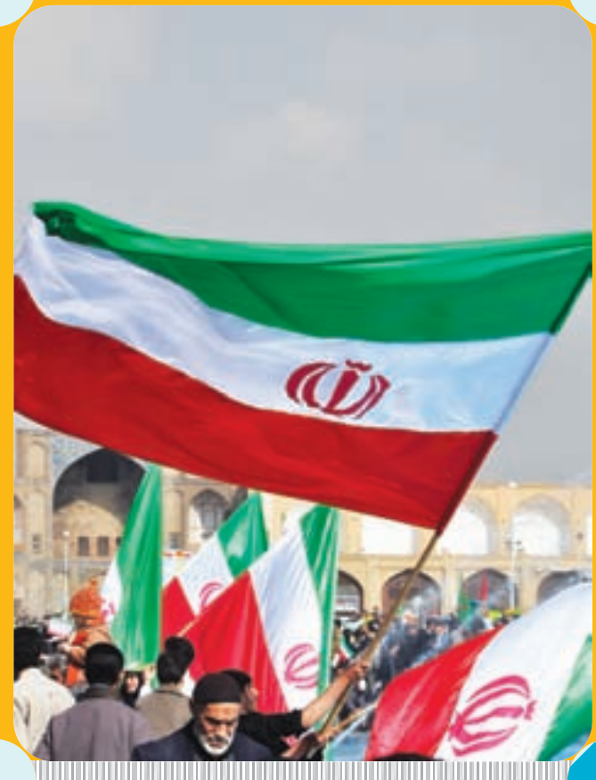
در حاشیه راهپیمایی ۲۲ بهمن