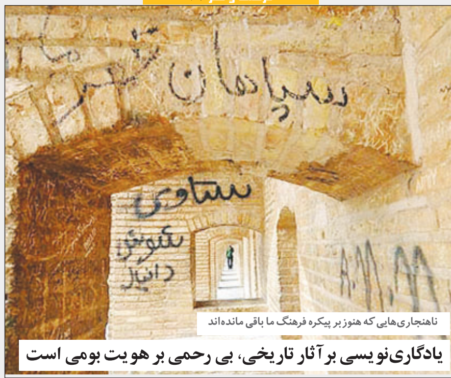
ناهنجاری‌هایی که هنوز بر بیکره فرهنگ ما باقی مانده‌اند یادگاری نویسی بر آثار تاریخی، بی‌رحمی بر هویت بومی است