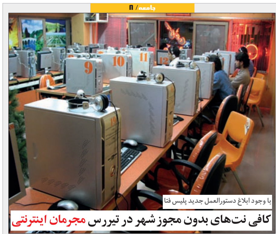
با وجود ابلاغ دستورالعمل جدید پلیس فتا کافی نت های بدون مجوز شهر در تیررس مجرمان اینترنتی