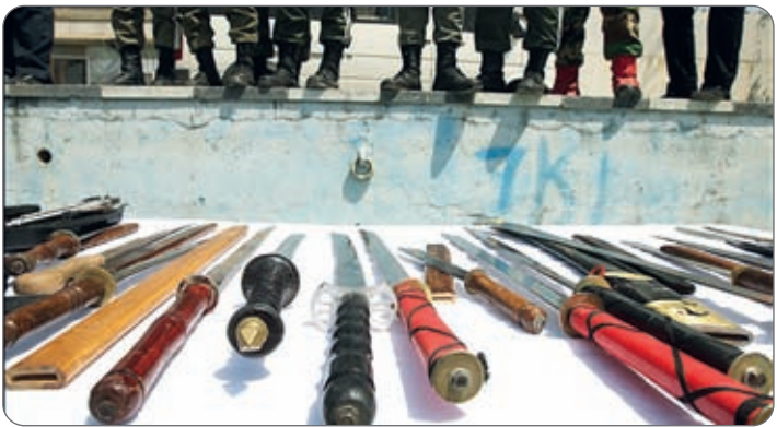
پلیس اصفهان در جریان عملیات مبارزه با حملان چاقو و سلاح سرد

خبر رییس پلیس آگاهی فرماندهی انتظامی استان اصفهان از اجرای طرح مبارزه با حملان چاقو های نامتعارف و سلاح های سرد طی هفته گذشته در اصفهان خبر داد و گفت: این طرح با قوت تمام تا پایان سال ادامه خواهد یافت. به گزارش اصفهان زیبا، سرهنگ “حسین حسین زاده” صبح دیروز با بیان این مطلب اظهار داشت:وقوع جرایم خشن و رفتارهای توام با خشونت و پرخاشگری و درگیری های فیزیکی و کلامی حتی عاطفی همیشه از دغدغه های پلیس بوده است و تعداد قابل توجهی از پرونده های تشکیل شده در پلیس به این عناوین اختصاص دارند. وی تصریح کرد:وقوع جرایم خشن همیشه با طرح و نقشه قبلی همراه نیست و علیرغم اینکه برخی از مجرمین از قبل نسبت به ارتکاب عملیات مجرمانه تجربه کسب می‌کنند و با طرح و نقشه قبلی سلاح تهیه و مرتکب جرم می شوند، تعداد قابل توجهی از دستگیری های پلیس در جرایمی نظیر ضرب و جرح، توهین و فحاشی ،نقص عضو و حتی قتل از متهمینی است که به صورت تکانشی و انفجاری و ناخودآگاه و بدون قصد قبلی از حالت عادی خارج و مرتکب جرم گردیده اند که در این بین نقش سلاح های سرد و چاقو