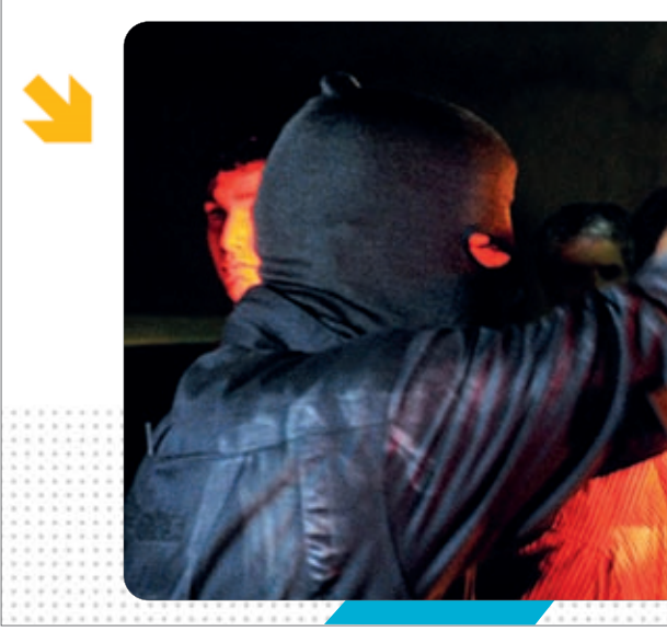
پلیس اصفهان در جریان عملیات مبارزه با حملان چاقو و سلاح سرد

راننده اظهار داشت: لکه‌های خون متعلق به یکی از سارقان می‌باشد. سپس راننده و خودروی مذکور به یگان انتظامی منتقل و ماموران در تحقیقات اولیه متوجه اظهارات ضد و نقیض این راننده شدند.