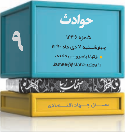
شماره ۱۴۳۶ چهارشنبه ۷ دی ماه ۱۳۹۰