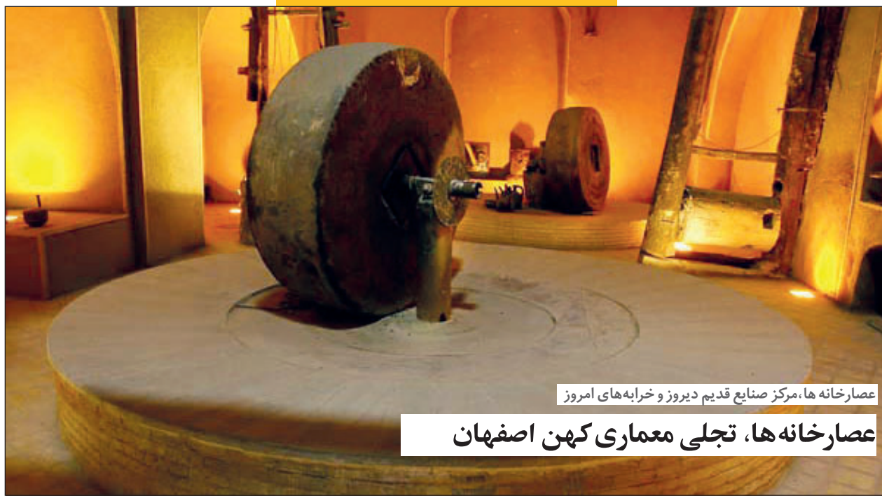
عصارخانه ها، مرکز صنایع قدیم دیروز و خرابه های امروز