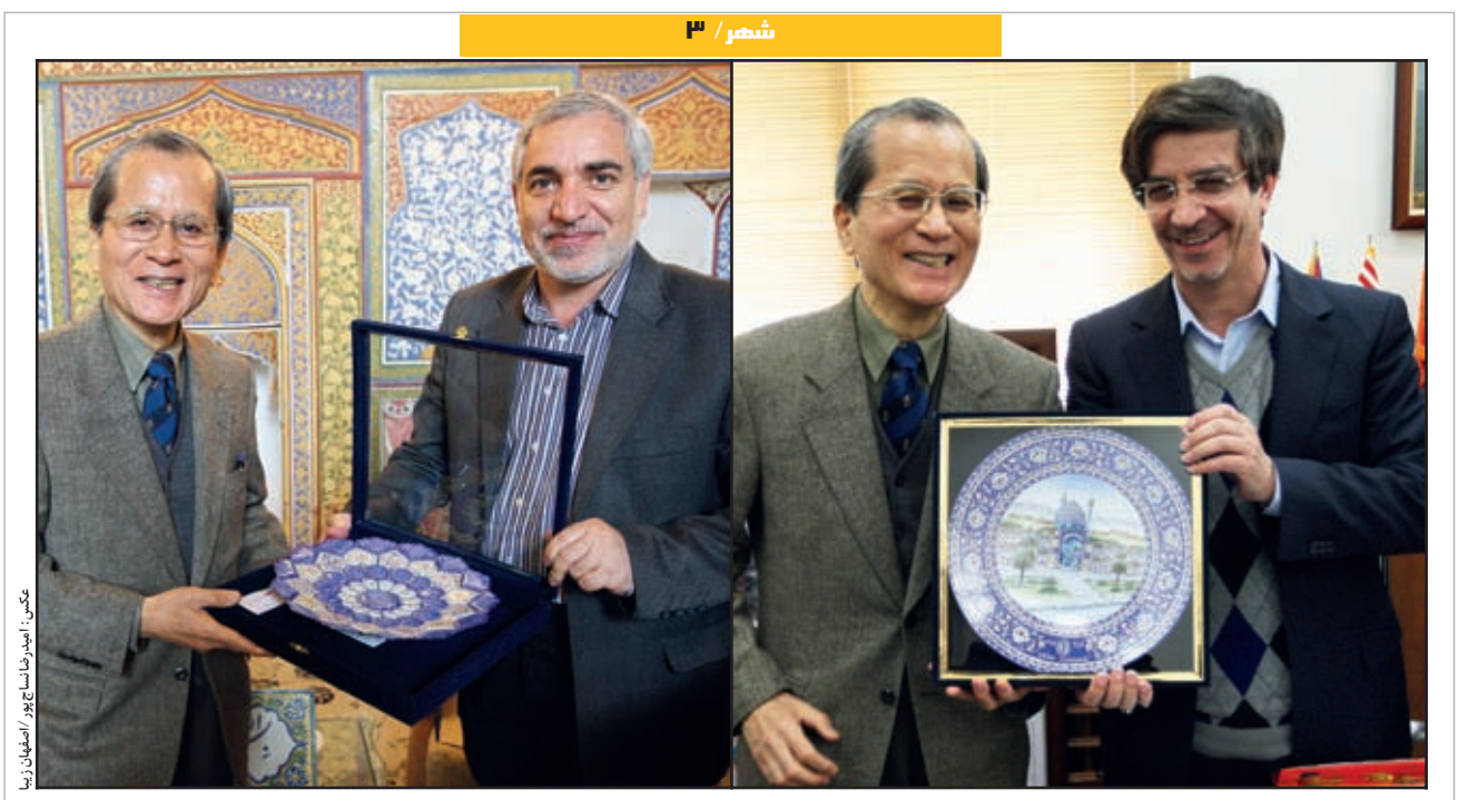
در دیدار استاندار و شهردار اصفهان با سفیر ژاپن؛ پیشنهاد خواهر خواندگی شهر کیوتو و اصفهان به سفیر ژاپن ارایه شد