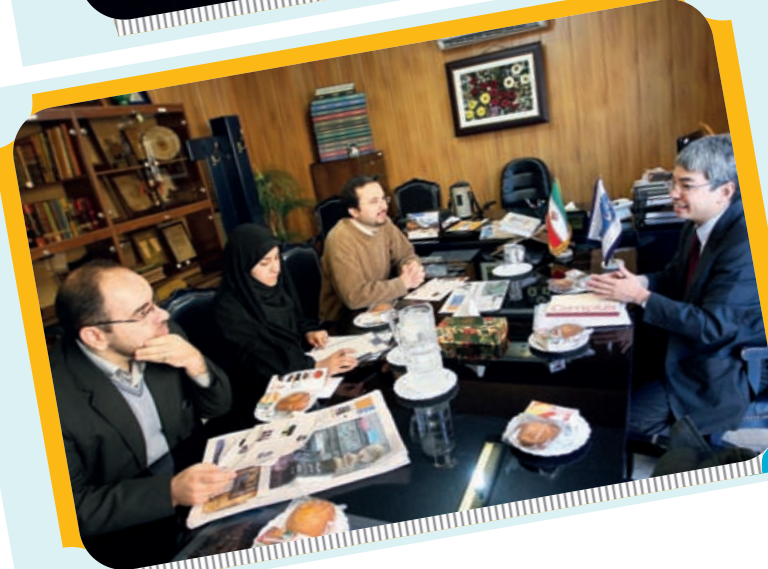
بازدید دبیر اول مرکز اطلاع رسانی و فرهنگی سفارت ژاپن در ایران از روزنامه اصفهان زیبا