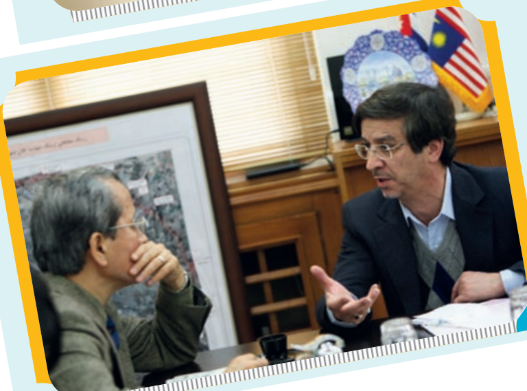
دیدار سفیر ژاپن با شهردار اصفهان