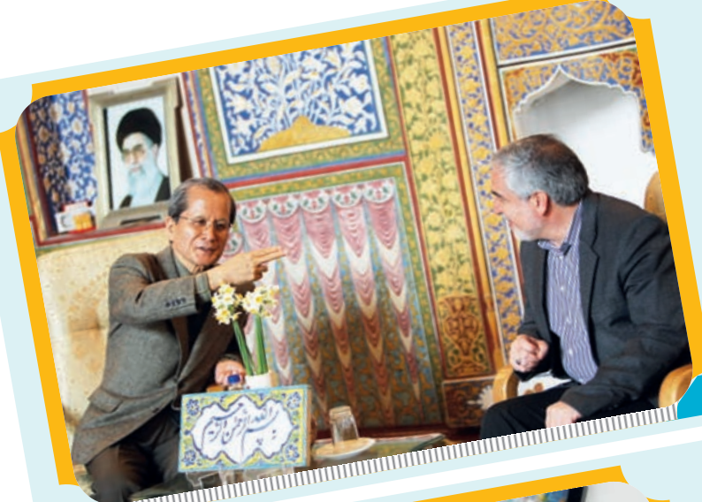
دیدار سفیر ژاپن با استاندار اصفهان