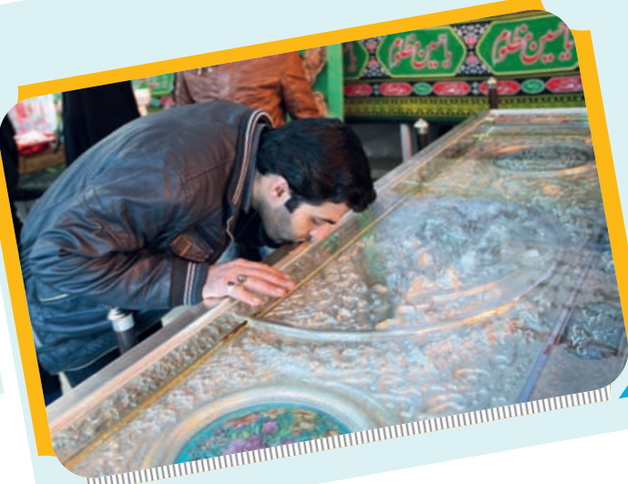
ارادت همیشگی مردم به ائمه اطهار (ع)