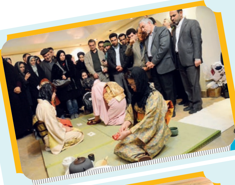
بازدید استاندار از مراسم چای خوری ژاپنی ها