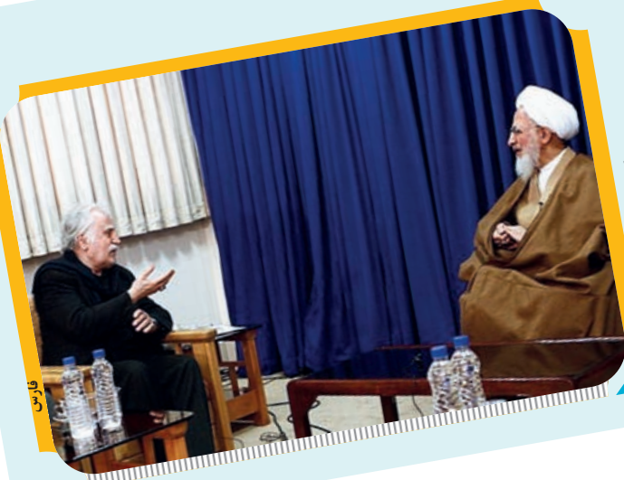
دیدار استاد فرشچیان با آیت الله جوادی آملی