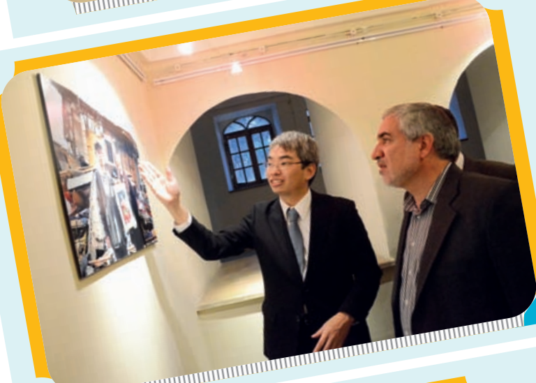
بازدید استاندار از نمایشگاه هفته فرهنگی ژاپن