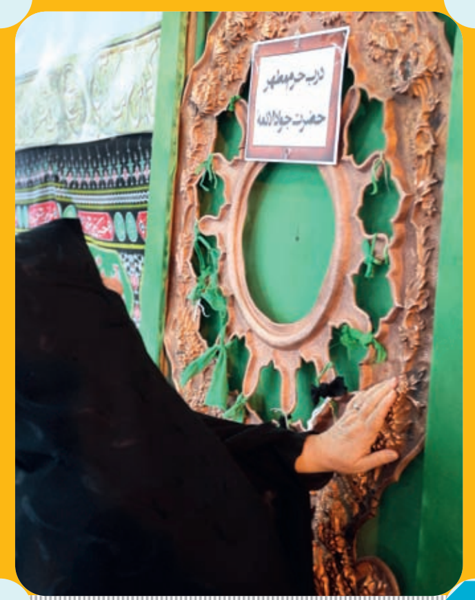
ساخت درب حرم مطهر حضرت جوادالائمه در اصفهان