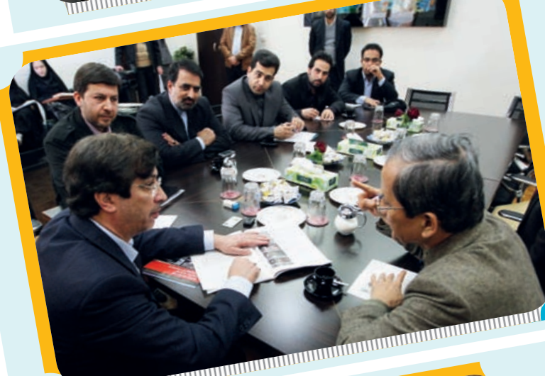
جلسه تبادل نظر شهردار اصفهان با سفیر ژاپن