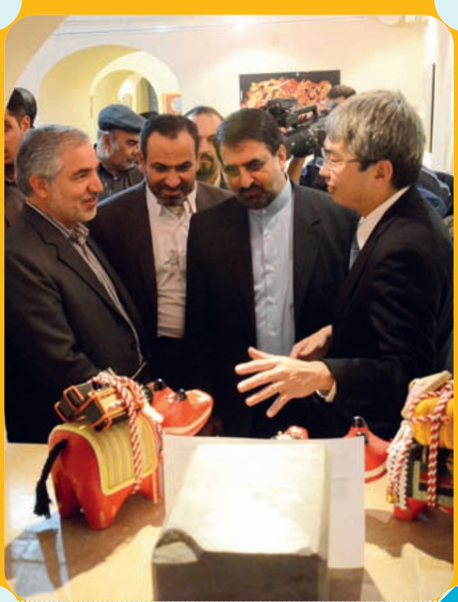
بازدید استاندار و معاون فرهنگی و اجتماعی شهرداری اصفهان از نمایشگاه هفته فرهنگی ژاپن