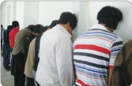
سرهنگ محمدعلی بختیاری فرماندهی انتظامی شهرستان اصفهان در راستای اجرای طرح پنج روزه ارتقای امنیت اجتماعی ۹۵ سارق حرفه ای را دستگیر و نزدیک به ۱۰۰ فقره سرقت را کشف کردند .

توسط پلیس از اعمال مجرمانه خود دست برداشته وبه جامعه پاک وسالم بازگردند. سرهنگ "بختیاری" در پایان با بیان اینکه تاکنون تمامی مالباختگان سرقت هاکشف شده شناسایی شده اند خاطر نشان کرد: متهمان به همراه پرونده جهت سیر مراحل قانونی تحویل مراجع قضایی شدند