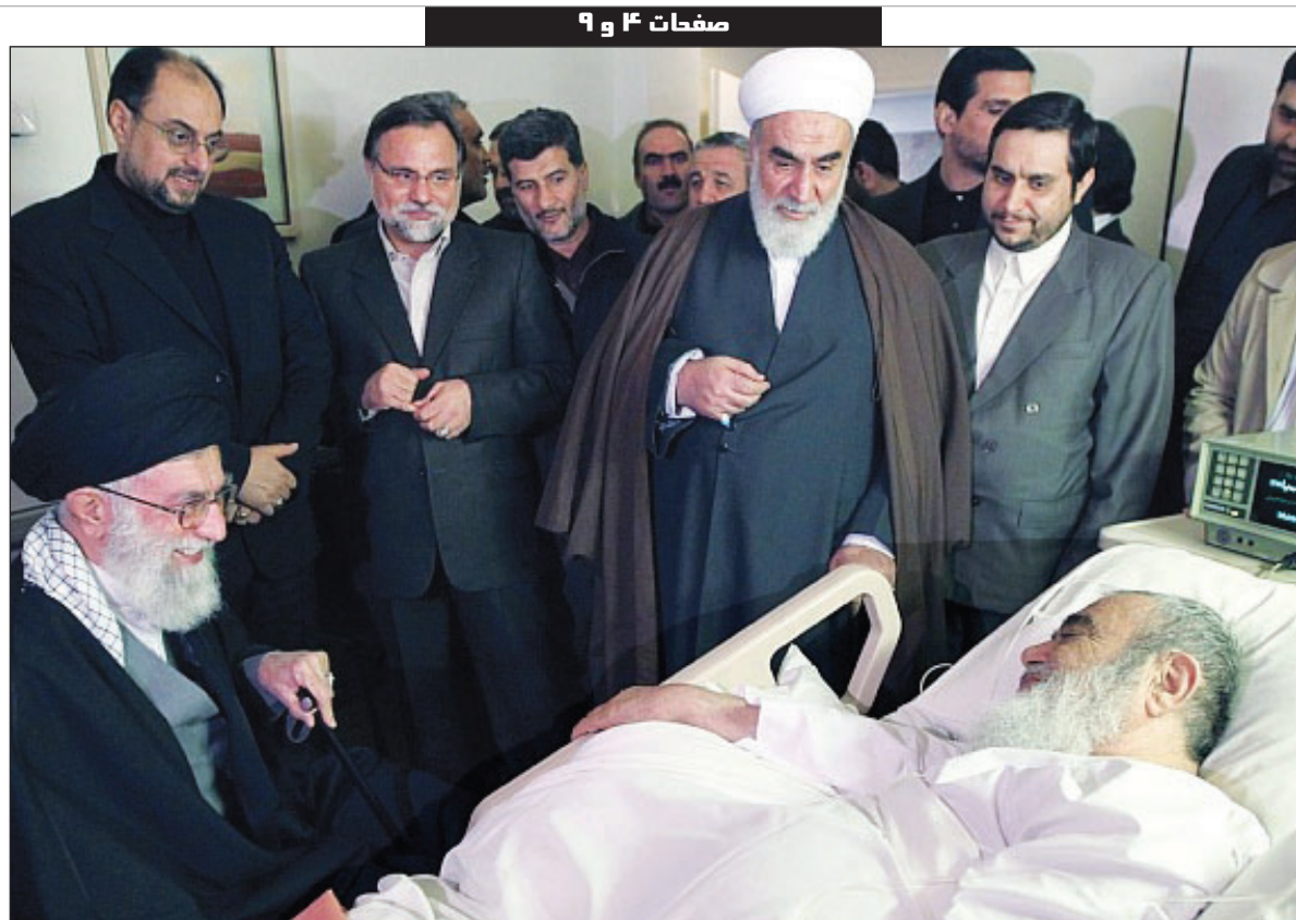
رهبر فرزانه انقلاب از آیت الله العظمی مظاهری عیادت کردند