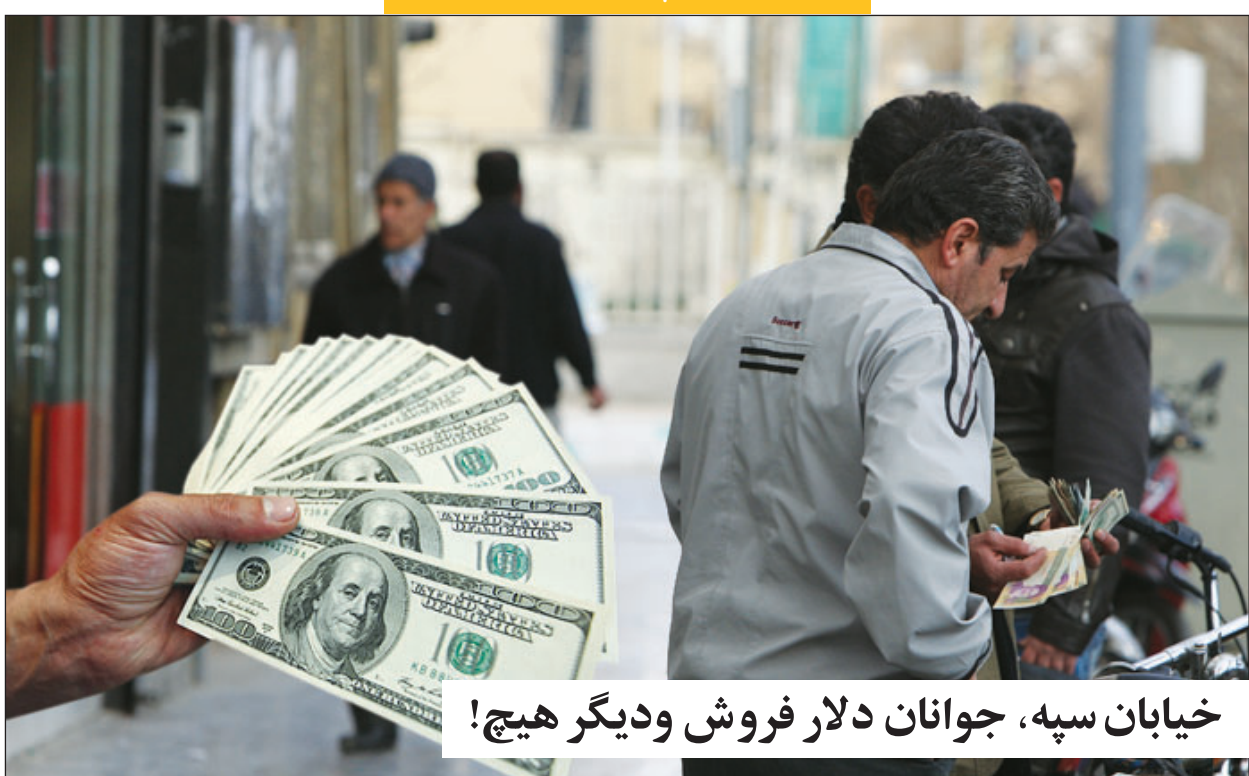
خیابان سپه، جوانان دلار فروش و دیگر هیچ!