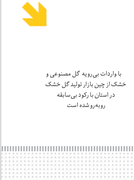
گل های مصنوعی چینی در بازار گل های ایران

با واردات بی رویه گل مصنوعی و خشک از چین بازار تولید گل خشک در استان با رکود بی سابقه روبرو شده است