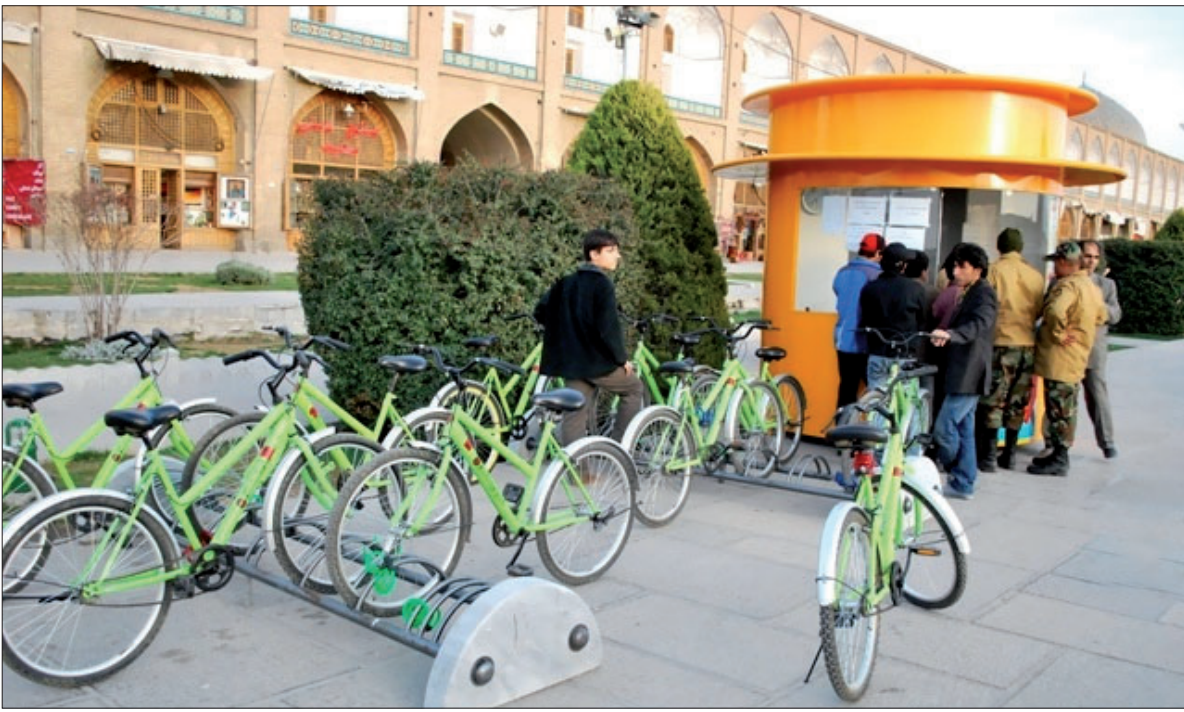
معاون حمل و نقل و ترافیک شهرداری اصفهان اعلام کرد: