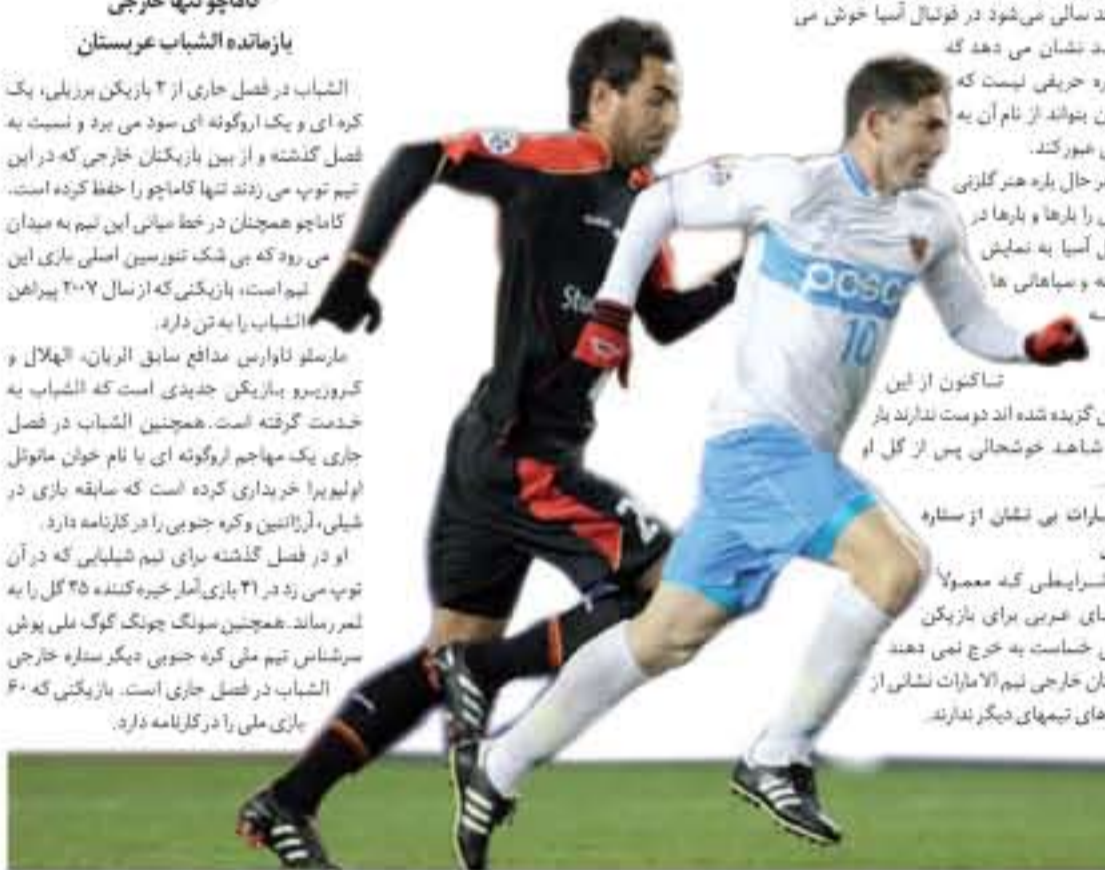
سیاهان ۴ - راه آهن ۰

الامارات بی نشان از ستاره خارجی در شرایطی که معمولاً تیمهای عربی برای بازیکن خارجی حساسیت به خرج نمی دهند بازیکنان خارجی تیم الامارات نشانی از ستاره های تیمهای دیگر ندارند.