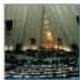
مجمع نمایندگان مجلس شورای اسلامی ملی نامه ای از رییس جمهور خواسته