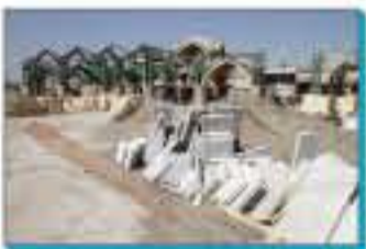
با اعلام انتشار یک هزار میلیارد ریال اوراق مشارکت برای اجرای فاز دوم طرح