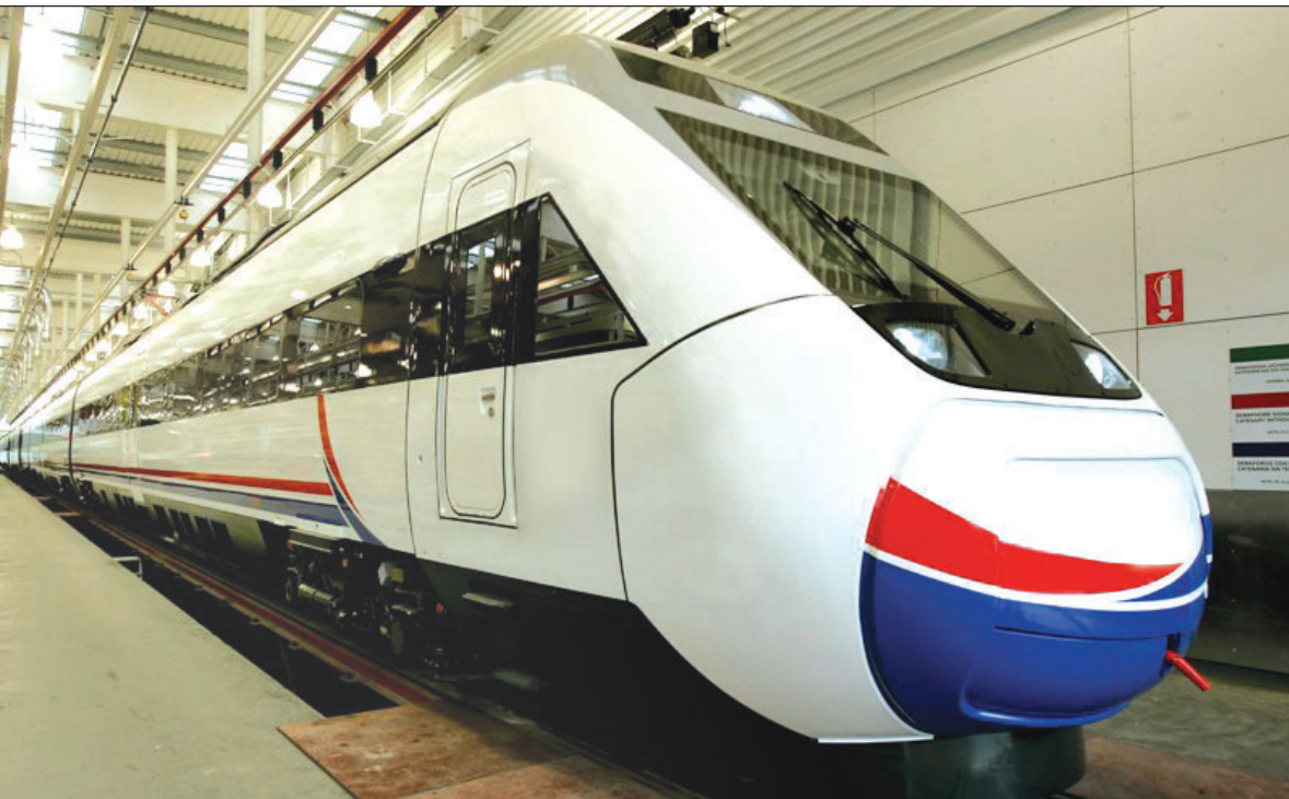
با راه‌اندازی قطار سریع‌السیر اصفهان - تهران: